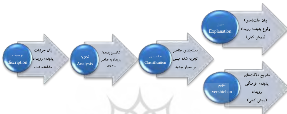
شکل ۴. فرایند تحلیل امنیت

چارچوب این مرحله (تبیین) بر اساس نظریه آشوب است. از نظر نگارنده فرایند تحلیل شامل مراحل زیر است: «توصیف» ۱ ، «تجزیه» ۲ ، «طبقه بندی» ۳ ، «تبیین» ۴ / «تفهّم» ۵ .