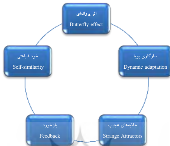
شکل ۳. ویژگی‌های سیستم‌های آشوبناک از دریچه نظریه آشوب