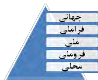
شکل شماره ۱: انواع سطوح (قالیاف، ۱۳۹۴)

مقیاس به عنوان دامنه جغرافیایی تأثیر عمل انسان یا گروه انسانی (فلینت، ۱۳۹۱: ۴۷). با توجه به اینکه گروه تروریستی داعش به عنوان یک عامل ژئوپلیتیکی برای انجام فعالیت‌های تروریستی خود از فضای مجازی، استفاده می‌کند؛ واضح است که سطح فعالیت این عامل ژئوپلیتیکی تنها محیط جغرافیایی نیست و این گروه تروریستی برای رسیدن به اهداف خود بخش مهمی از فعالیت‌هایش را در فضای مجازی انجام می‌دهد.