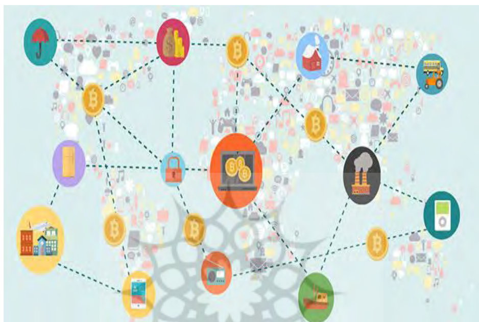
شکل (۱): نمودار شکلی شیوه مبادله به سبک بیت‌کوین را نشان می‌دهد.

که در روزنامه «واشنگتن پست» منتشر شد، نوشت: «رسانه‌های مرتبط با گروه تروریستی داعش پس از آن که سرزمین‌های تحت اختیارشان در سوریه و عراق را از دست دادند اغلب فعالیت‌های مالی خود را به دنیای مجازی منتقل کرده و بیش از گذشته از بیت کوین استفاده می‌کنند».