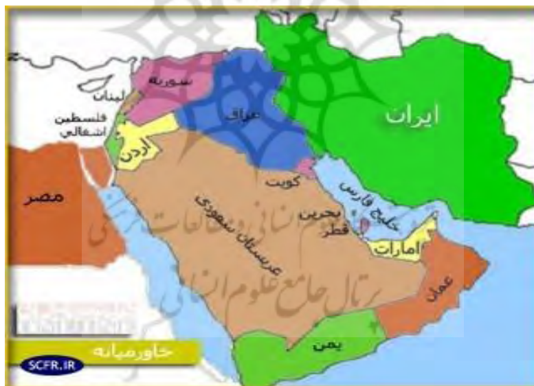
شکل شماره ۲: نقشه محدوده‌ی جغرافیایی خاورمیانه، منبع www.lib.utexas.edu/map/middle.ea

آنچه که به عنوان ویژگی‌های خاورمیانه شرح داده شد؛ همان عوامل و عناصری هستند که سبب بروز بحران و یا به بیانی دیگر، سبب ظهور رنسانس ایدئولوژیک در این جغرافیا شده‌اند.