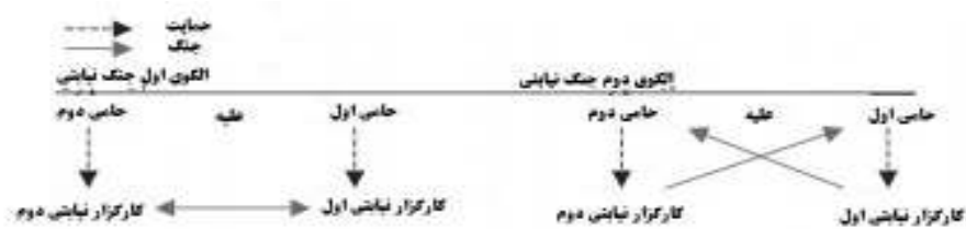
شکل ۱- الگوهای رایج جنگ نیابتی

است. هاینسچ در این باره به موضوع کنترل کلی ۱ در مقابل کنترل مؤثر ۲ اشاره دارد (Heinsch, 2015: 341-343).