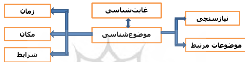
نموار ۲ - ارتباط موضوع‌شناسی و نیازشناسی و غایت‌شناسی

نیازسنجی، در یک ارتباط متقابل با اهداف و غایات هر رشته مشخص می‌کند که چه نظام موضوعاتی، متناسب با نیازهای شناسایی شده و اهداف و غایات انسان در آن رشته علمی، در اولویت پژوهشی قرار می‌گیرد؛ ضمن آنکه رشته‌های علمی نیز جزایر مستقل از یکدیگر نیستند و در نهایت همه رشته‌های علمی یک هدف و یک غایت را با توجه به رسالتی که بر عهده دارند، به انجام می‌رسانند.