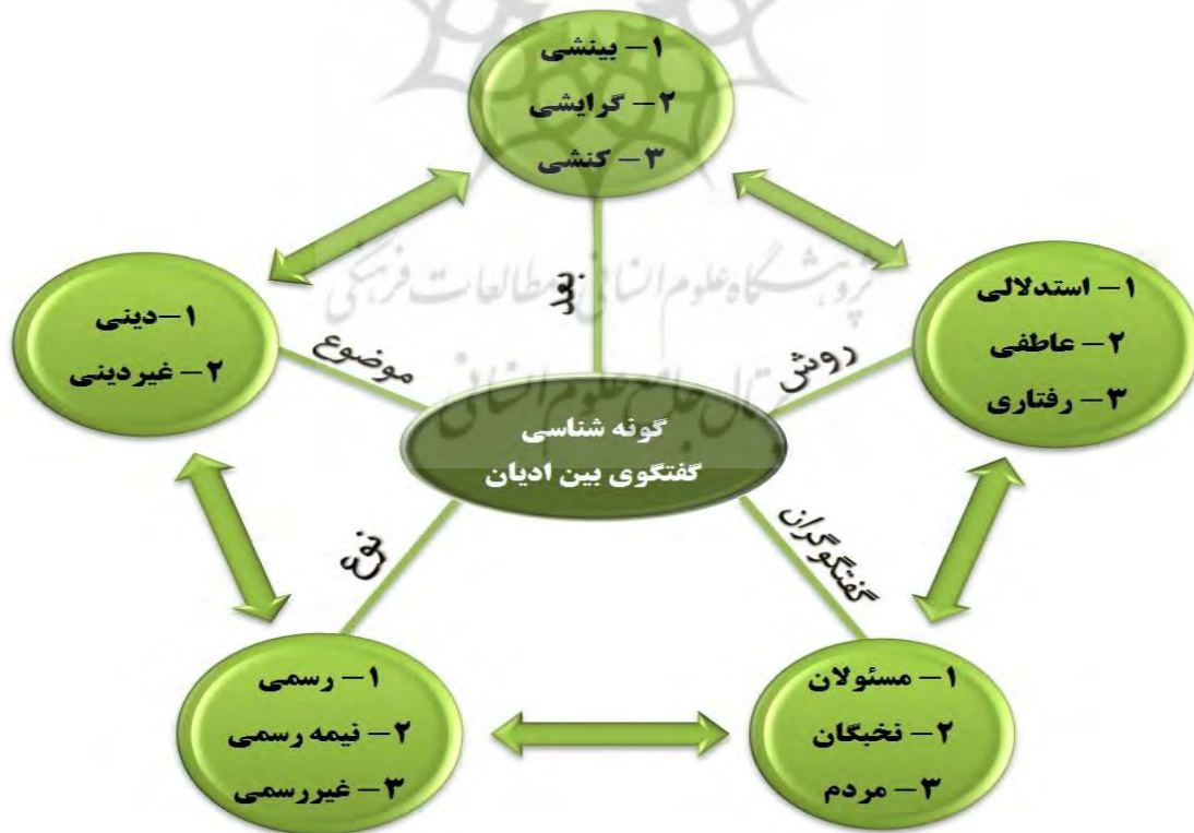
شکل شماره (۳): الگوی گونه‌شناسی گفتگوی بین ادیان

در نهایت درخور ذکر است از تصور حالات و صورت‌های مختلف شاخص‌ها در گونه‌شناسی گفتگوی بین ادیان در صورت تشابه گفتگوگران، ۵۴ گونه و در صورت تشابه‌نداشتن گفتگوگران، ۱۶۲ گونه گفتگوی بین ادیان شمردنی است. به بیانی دیگر، در صورتی که گفتگوگران گفتگوی بین ادیان مشابه یکدیگر باشند، یعنی هر دو جزء رهبران یا مسئولان باشند، از تصور سایر شاخص‌ها یعنی بُعد، روش، نوع و موضوع و ارتباط اینها