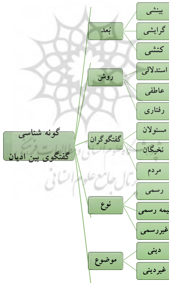
شکل شماره (۲): گونه‌های گفتگوی بین ادیان براساس شاخص‌های پنجگانه

۵- موضوع: موضوع گفتگوی بین ادیان براساس مضاف‌الیه (یعنی دین) که ابژه گفتگو قرار می‌گیرد، دینی یا غیردینی است. گفتگوهای دینی ناظر به مقایسه