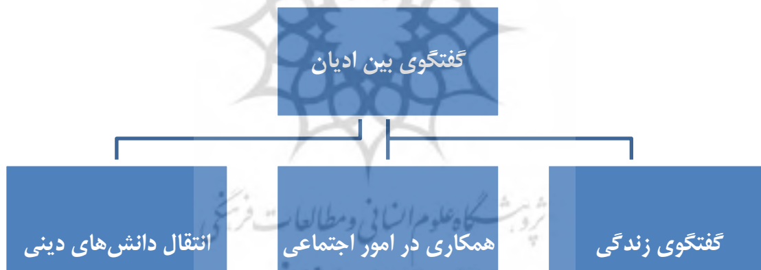
شکل شماره (۱): گونه‌شناسی گفتگوی بین ادیان براساس سند واتیکان

یکی از راههای بررسی تعریف شناختی گفتگوی بین ادیان، واکاوی گونه‌های مختلف آن است. در همین رابطه، یکی از مهم‌ترین گونه‌شناسی گفتگوی بین ادیان مربوط به سند واتیکان است. «گفتگو» در این سند به شکل کلی و