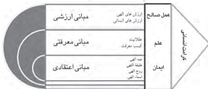
شکل ۱-۲. مدل مفهومی مبانی کرامت انسانی از منظر آموزه های دینی با تأکید بر فرهنگ رضوی

بنابراین، بر اساس منظومه مضامین مبانی کرامت انسانی از منظر آموزه های دینی با تأکید بر فرهنگ رضوی، می توان مدل مفهومی که همانند شبکه مضامین، هم ارتباط مضامین و هم ارتباط مفاهیم را ترسیم کند و هم جایگاه هر یک از مبانی را در شکل گیری کرامت انسانی نشان دهد، ارائه نمود. بر اساس این مدل مفهومی، مبانی اعتقادی کرامت انسانی خمیرمایه تبیین و تحلیل مبانی کرامت انسانی را تشکیل می دهد. درخت تنومند کرامت انسانی بر ریشه های مستحکم اعتقاد و ایمان به خداوند و علم و معرفت و عمل صالح استوار گشته و میوه این درخت عزت و شرافت انسان است. این مدل و نقشه مفهومی، مسیر سعادت و کرامت انسان را ترسیم می کند.