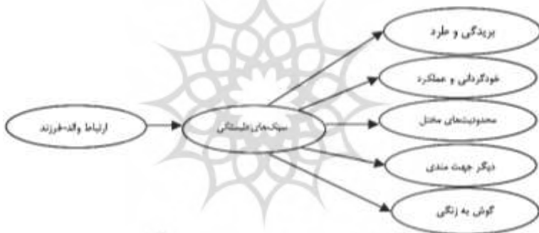
شکل ۱. الگوی پیشنهادی روابط بین الگوهای ارتباط والد-فرزند و طرحواره‌های ناسازگار اولیه با نقش واسطه‌ای سبک‌های دلبستگی

۲. کدامیک از سبک‌های دلبستگی ایمن، اجتنابی و دوسوگرا می‌توانند رابطه بین الگوهای ارتباطی والد-فرزند و طرحواره‌های ناسازگار اولیه را میانجیگری کنند؟