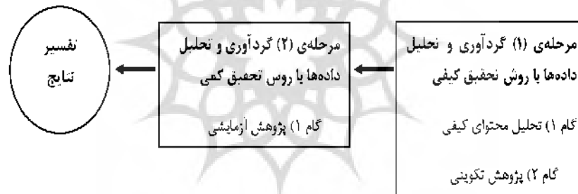
شکل 2: روش گردآوری اطلاعات

با توجه به موضوع تحقیق که به شناخت رابطه سبک زندگی و طلاق در زوجهای شهر تهران می‌پردازد، از نظر هدف، کاربردی و از نظر چگونگی گردآوری داده‌ها، تحقیق آمیخته اکتشافی است. یکی از مزایای مهم و قابل توجه در طرحهای تحقیقاتی آمیخته این است که نسبت به هر یک از طرحها (کمی یا کیفی)، تصویری جامع‌تر و بهتر از مسئله پژوهش ارائه می‌دهد (علی‌اکبری و همکاران، 1393: 65). پژوهش حاضر مبتنی بر روش تحقیق آمیخته از نوع طرح اکتشافی متوالی و با مدل تدوین و ارائه مدل است. طرح اکتشافی، دو مرحله‌ای بوده، نتایج حاصل از اولین روش پژوهش، ورودی دومین روش پژوهش به شمار می‌آید.