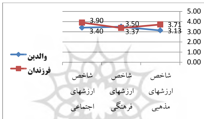
نمودار (۱): توزیع فراوانی شاخص میانگین کل ارزش‌های والدین و فرزندان

شاخص‌های مرکزی و پراکندگی ارزش‌های والدین و فرزندان: جدول آماره‌های مرکزی و پراکندگی نشان می‌دهد حداقل نمره شاخص ارزش‌ها ۱ و حداکثر نمره ۵ می‌باشد.