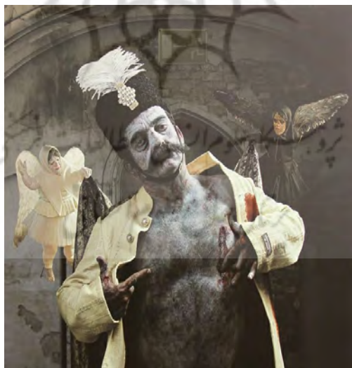
تصویر ۱- رستاخیز، آندرگراند، سیامک فیلی‌زاده، ۱۳۹۳، میکس مدیا، گالری آران، (نیوال، ۱۳۹۳: سایت)

۱- بدن شاه: ابزار در یک رابطه حاکمیت‌مند