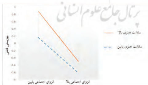
نمودار ۱. اثرات تعاملی انزوای اجتماعی و سلامت معنوی در پیش بینی بهزیستی

همانگونه که در جدول ۲ مشاهده می‌شود آزمون تغییر R^2 معنی‌دار است؛ یعنی در مدل اول مقدار R^2 = 0/615 است برای انزوای اجتماعی، که در مدل دوم با ورود سلامت معنوی R^2 = 0/652 شد و در نهایت با ورود تعامل دو متغیر مقدار R^2 = 0/659 شد که همچنان معنادار است. بنابراین، سلامت معنوی برای رابطه انزوای اجتماعی و بهزیستی ذهنی نقش تعدیل‌گری دارد. با توجه به بالا رفتن میزان واریانس تبیین شده متغیر بهزیستی ذهنی با ورود متغیر تعاملی انزوای اجتماعی و سلامت معنوی، می‌توان نتیجه گرفت که سلامت معنوی قادر به تعدیل رابطه بین این دو متغیر است. به عبارتی، رابطه بهزیستی ذهنی و انزوای اجتماعی در سطوح بالا و پایین متغیر سلامت معنوی متفاوت است. به منظور روشن نمودن ماهیت اثر تعدیل‌گری، نمودار تعامل با استفاده از ضریب رگرسیون استاندارد خطوط رگرسیون برای افراد بالا و پایین رسم شد. نمودار ۱ نحوه تعامل انزوای اجتماعی و سلامت معنوی را در ارتباط با بهزیستی ذهنی نشان می‌دهد.