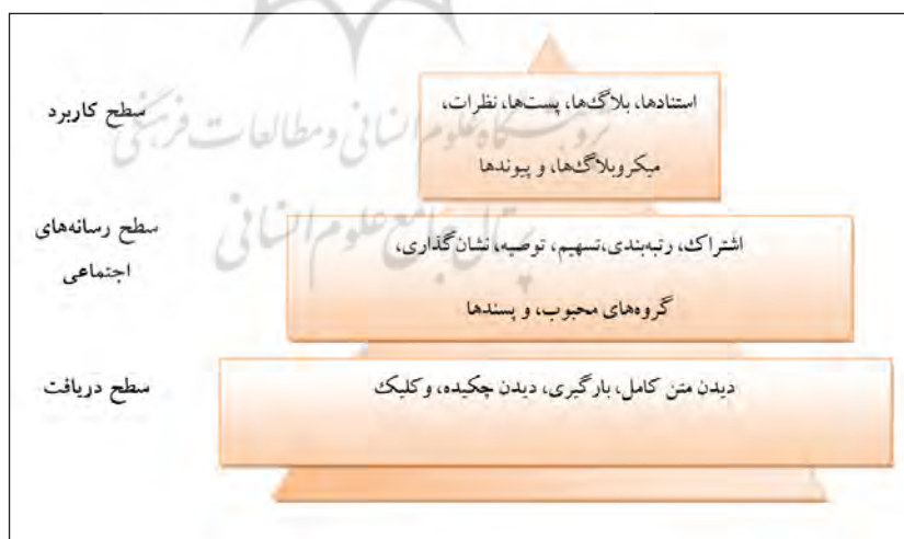
شکل ۱. هرم سطوح مختلف عمق اثرگذاری دگرسنجه‌ها (جانپینگ و هوکیانگ، ۲۰۱۵)

به‌طوری‌که در شکل ۱ دیده می‌شود در مدل ارائه‌شده، قاعده مثلث، «سطح دریافت»؛ طبقه میانی آن، «سطح رسانه اجتماعی»؛ و هرم آن، «سطح کاربرد» ۳ نامیده شده است. تعداد کلیک، بارگیری، مشاهده چکیده، یا متن کامل مقاله، سنجه‌هایی هستند که در دسته نخست قرار می‌گیرند. تعداد پسند، بوکمارک، توصیه، اشتراک سنجه‌های دسته‌بندی‌شده با نام «سطح رسانه اجتماعی»؛ و تعداد لینک‌ها، نظرها، استنادها نیز سنجه‌های متعلق به سطح سوم یعنی «سطح کاربرد» هستند.