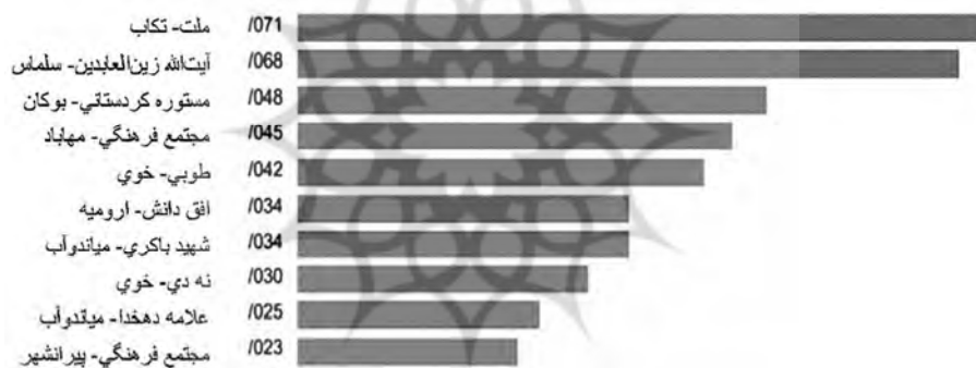
نمودار ۴. رتبه‌بندی کتابخانه‌ها در شاخص خدمات مرجع

نمودار ۴ تعداد ۱۰ کتابخانه برتر را در شاخص خدمات مرجع نشان می‌دهد.