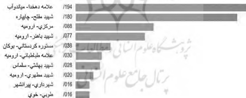
نمودار ۳. رتبه‌بندی کتابخانه‌ها در شاخص خدمات الکترونیکی

نمودار ۳ تعداد ۱۰ کتابخانه برتر را در شاخص خدمات الکترونیکی نشان می‌دهد.