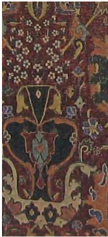
تصویر ۱- نقش گل و گلدانی در قالی کرمان، شاه‌عباس اول صفوی (پوپ و آکرمن، ۱۳۸۷، ج ۱۲: لوح ۱۲۱۹)

هنر قالی‌بافی، این شکل هلالی، «سینی» نام گرفته و به اشکال متنوعی ترسیم شده است (همان: ۳۷).