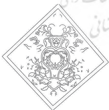
تصویر ۵- طرح تهیه‌شده از کاشی با نقش گل و گلدانی در حمام شاهزاده‌ها (نگارنده)

تنها نمونه موجود از کاربرد نقوش گلدانی بر کاشی‌کاری حمام‌های عصر صفوی، در حمام شاهزاده‌ها واقع در شهر اصفهان، به جای مانده است. حمام شاهزاده‌ها در جنوب محله مسجد حکیم، بنا شده و سال ۱۳۵۴ با شماره ۱۱۵، در فهرست آثار ملی به ثبت رسیده است. در منابع تاریخی مکتوب، احداث این حمام، به یکی از شاهزادگان اواخر عصر صفوی منسوب شده (رفیعی مهرآبادی، ۱۳۵۲: ۴۰۷) و به‌عنوان حمام ردیف دومی، در مقایسه با حمام‌های خسرو آقا، علی‌قلی آقا و حمام شاه معرفی شده است (الاصفهانی، ۱۳۶۸: ۸۰-۸۱). فضاهای داخلی حمام، با کاشی‌های یک‌رنگ چندضلعی فیروزه‌ای و سیاه‌رنگ و کاشی‌های هفت‌رنگ با نقوش گیاهی،