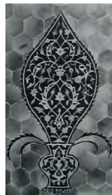
تصویر ۲- سرو- گلدان اسپر کاشی‌کاری خانقاه اصفهان، سده نهم هجری قمری (همان، ج ۸: ۵۴۴)

اما در عصر قاجار، با ورود عناصری چون کارت پستال‌های غربی، نقاشی‌های اروپایی و تقلید از موضوعات اروپایی توسط هنرمندان قاجاری، نقوش گلدانی واقع‌گرا در انواع هنرها، نظیر نگارگری، قالی‌بافی و کاشی‌کاری رواج یافت.