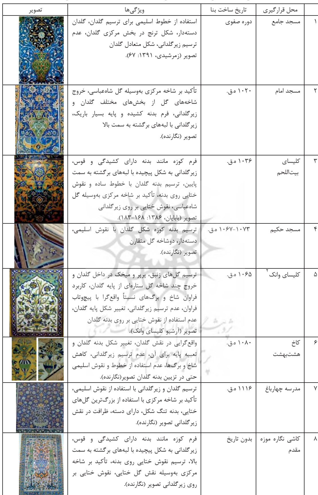
جدول ۱. برخی از نقوش گلدانی تصویر شده در کاشی‌کاری بناهای عصر صفوی در اصفهان و ویژگی‌های آن‌ها