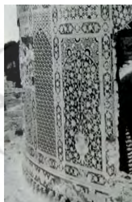
تصویر ۳- نقش گل و گلدانی بر بدنه گنبد مزار خواجه ابونصر پارسا در بلخ، اواخر سده نهم هجری (همان، ج ۸: ۴۲۳)