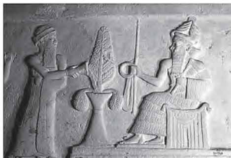
تصویر ۱۱. بخشی از حجاری‌های سنگ یادمان اور- نمو، یزشگری در حال نثار آب پای گلدان آیینی، دو قطره آب از دو سوی گلدان در حال چکیدن است. متعلق به سلسله سوم اور، محل نگهداری دانشگاه فیلادلفیا. مأخذ: مجیدزاده، ۱۳۸۸: تصاویر ۶-۳۳۵

(مالاندر، ۱۳۹۱: ۵۳؛ گیرشمن، ۱۳۸۸: ۱۷۸؛ فرای، ۱۳۶۸: ۱۹۰) آنگاه احتمالاً سندهای مکتوب موجود در خصوص اهمیت مذهبی درخت سرو را بایستی در متون مزدی سنایی جستجو کرد. در بندهش نام درخت سرو در کنار سایر درختان آمده اما اشاره‌ای به جایگاه مذهبی این درخت نشده است. گیاهان سالوار خود چندین دسته‌اند: «هرچه را بار به خوار بار مردمان میهمان نیست و سالوار است، مانند سرو و چنار، سپیدار و شمشاد و شیز و گز و دیگر از این گونه، دار خوانند (فرنبخ دادگی، ۱۳۶۹: ۸۷). تنها سند زرتشتی ذیل بند هفدهم کتاب وجرکرد دینی آمده است هنگامی که آشو زرتشت نزد گشتاسب آمد سه چیز با خود داشت: کراسه اوستا، آتش برزین مهر و درخت سرو. ... آن درخت سرو را بر زمین کاشت. چون بالا آمد، هر برگ که از شاخ می‌رویید بر آن برگ به فرمان اورمزد مینوانه به سخن پاک نوشته شده بود که: «ای گشتاسب، دین را بپذیر» (آموزگار، تفضلی، ۱۳۷۰: ۷-۱۶۶). وجرکرد یا وزرکرد دینی کتابی است از مؤلفی ناشناخته به زبان