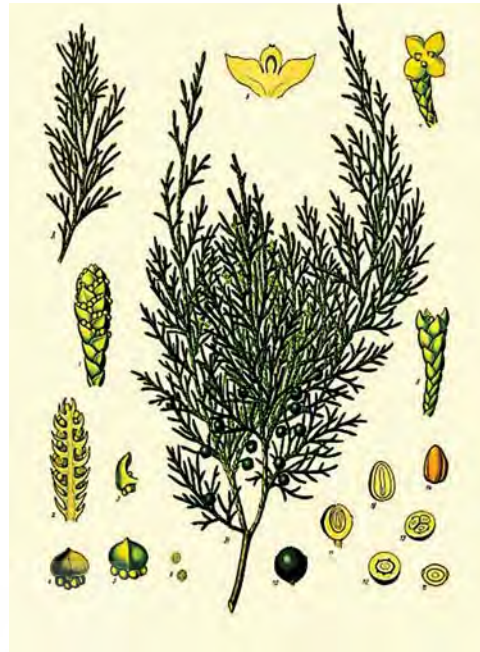
تصویر ۱۶. برگ و میوه‌ی سرو کوهی.

از سوی دیگر دقت و ظرافت نقوش درخت موجود در مجموعه تخت جمشید - همانگونه که پرهام و آزادی نیز ذکر کرده‌اند قابل تحسین و توجه است - نظر پرهام و آزادی را در خصوص اهمیت درخت سرو در دوره هخامنشی رد می‌نماید. (تصاویر ۱۲ و ۱۳) همانگونه که در تصویر مشخص است، میوه این درختان کاملاً مخروطی شکل بوده و برگ‌ها کاملاً سوزنی شکل هستند. این جزئیات به روشنی تفاوت آشکار با جزئیات درختان سرو بومی ایران دارد. درختان سرو بومی ایران چهار گونه هستند: سرو زرین ۳ ، سرو ناز ۴ ، سرو خمره‌ای (طبری) ۵ و سرو کوهی ۶ (مرتضوی. طالبی، ۱۳۹۱: ۴۱-۳۴). برگ درخت سرو زرین یا سرو معمولی «فلسی»، به شکل تخم مرغی با نوک گرد، بسیار کوچک و کمتر از ۶ میلی‌متر طول و به رنگ سبز تیره است، آرایش آن متقابل و کاملاً روی هم چسبیده. در درختان این گونه «مخروط نر به شکل تخم مرغی کشیده، نوک آن گرد به رنگ سبز روشن تا زرد و در انتهای شاخه‌های کوتاه قرار دارد. مخروط ماده کروی و یا تخم مرغی، سطح آن صاف تا کمی چروکیده و ناهموار و رنگ آن سبز روشن تا تیره و براق است.» ارتفاع این درخت به ۲۰ تا ۳۰ متر و قطر تنه آن بیش از یک متر می‌رسد. زرین از جمله درختان دیرزیست ایران به شمار می‌رود. سرو ابرکوه با سن تقریبی ۴۵۰۰ سال از این گونه است (کرووری و دیگران، ۱۳۷۷: ۵۰). گونه دیگر سرو ناز یا سرو شیراز است که از محبوب‌ترین فرم‌های سرو محسوب می‌شود. این درخت دارای ساقه و انشعابات قائم بوده و چون شاخه‌ها