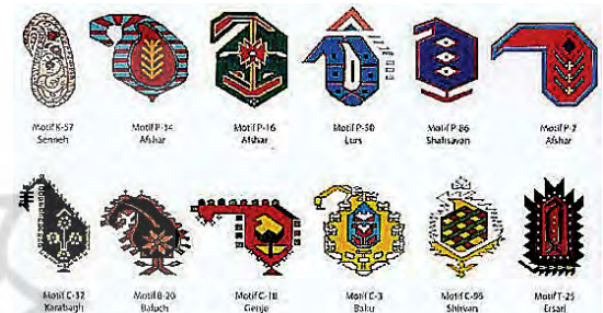
تصویر ۸. نمونه‌هایی از نقوش بته در زیراندازها و قالی‌های ایران و قفقاز به شکل درخت. منبع: (stone, 1997: 236)

یک نقش‌مایهٔ شگفت‌انگیز می‌داند که به نام فارسی‌اش در هنر فرش‌بافی شناخت می‌شود و معنی نام آن یک دسته برگ و یا درختچه است. او سرخ‌هایی در بین نقوش قالی هریس، نقوش تزیینی کاخ شاه جهان به شکل انبه برای منشأ گیاهی آن یافته است. وی معنای بته را در بین انگلیسی‌زبانان مخروط کاج و در بین آلمانی‌زبانان تاج نخلی شکل ۲ می‌داند (FORD, 2007, 52). این نقش‌مایه در هر منطقه به شکل‌های گوناگون و متنوعی تاویل و تفسیر شده است. در هند سوگی (طوطی ماده)، انبه و گاه لیچی (سرخالو) ۳ نامیده می‌شود. نظریهٔ ضعیفی هم این نقش را به چشم بد تفسیر می‌کند اما چهارچوب محکمی ندارد. منشأ احتمالی دیگر آن بته در ارتباط با پرندۀ خورشید است. او همچنین نظریات دیگر را از قبیل ریشه‌های جانوری و شعلهٔ آتش مقدس را مطرح کرده و وی احتمال می‌دهد که تنوع نقش‌های گوناگون بته نشان‌دهندهٔ منشأهای گوناگون این نقش‌مایه است (پیشین: ۵۴). نیکلاس پاردون بته را واژه‌ای فارسی معادل دسته‌ای برگ دانسته است. و در خصوص اصل و منشأ بته به مواردی از قبیل مخروط کاج، بادام، گلایی، و حتی با شعله آتش مقدس زرتشت و نقش از اثر مشمت بسته بر سطح گلی یا گچی اشاره کرده است.