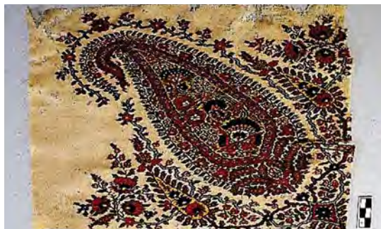
تصویر ۹. بته با گل‌های مختلف روییده بر اصلی واحد، پته دوزی، مکان و تاریخ نامعلوم، محل نگهداری موزه مقدم، شماره ثبت: ۲۳۹، مأخذ: آرشیو عکس موزه مقدم.

تبیین ویژگی‌های نقش‌مایه‌بته باتوجه به نظریات و آراء پژوهشگران در باب اصل و منشأ آن در هنر اسلامی و نقدی بر نظرگاه درخت سرو به عنوان منشأ این نقش