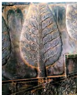
تصویر ۱۲. تصویر ۱۲: تصویر یک درخت سوزنی برگ در پلکان آپادانا، تخت جمشید. منبع: (شهپازی، ۱۳۸۹: ۱۲۳)