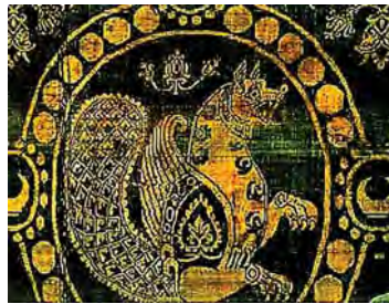
تصویر ۱۷. یک قطعه پارچه ابریشم ساسانی با نقش جانوری افسانه‌ای (سیمرغ یا شیردال؟) که در بن بالش درختی نقش بسته است. محل نگهداری: موزه ویکتوریا و آلبرت، لندن، مأخذ: www.heritageinstitute.com