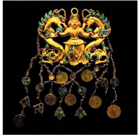
تصویر ۱. آرایه سر، به ابعاد ۱۲۵×۶۵ سانتیمتر، مکشوفه از گور شماره ۲، طلا تپه، افغانستان، متعلق به سده یکم میلادی.

پرهام به ارائه نمونه‌های تاریخی این نقش‌مایه پرداخته است. در این مقالات منشأهای گوناگونی برای این نقش‌مایه پیشنهاد شده است.