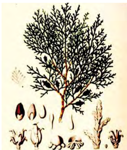
تصویر ۱۵. برگ و مخروط سرو طبری (خمرهای).

درخت سرو به عنوان تنها درخت در مجموعه تخت جمشید است که حجاران در تصویر آن نهایت دقت و ظرافت را به کار برده‌اند و ریزه‌کاری‌ها را با دقت بالایی به نمایش گذاشته‌اند. (پرهام، آزادی، ۱۳۷۰: ۱-۲) این موضوع خود در چند بخش قابل تأمل و بررسی است: نخست اینکه اگر بار مذهبی درخت سرو در بین‌النهرین را بپذیریم، پذیرفتن این امر در خصوص ایلامیان اندکی دشوار است زیرا منابع مکتوب در خصوص مذهب و باورهای دینی ایلامیان اندک و پراکنده بوده و بیشتر هم مربوط به نام خدایان است. (مجیدزاده، ۱۳۸۶: ۵۰؛ قدیانی، ۱۳۸۷: ۶۰-۵۹؛ بویس، ۱۳۷۵: ۲-۳) دیگر اینکه در خصوص دین ایران دوره هخامنشی نیز تا به امروز شواهد و مدارک مکتوب اندکی در دست بوده (هوار، ۱۳۹۰: ۶-۹۱؛ قدیانی، ۱۳۸۷: ۷۲) و این امکان را به پژوهشگر نمی‌دهد که بتواند دلایل متقنی در خصوص جایگاه مذهبی درخت سرو در این ادیان ارائه دهد. اگر چنانچه باور عمومی در خصوص رواج آیین زرتشتی از روزگار داریوش یکم هخامنشی به بعد اصل قرار گیرد