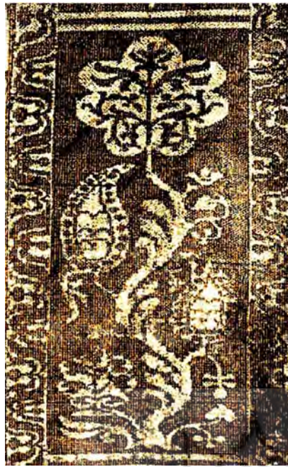
تصویر ۲. تصویر برگ درخت، قطعه‌ای از یک پارچه ابریشمی، مکشوفه از اخمیم، متعلق به سده ۷ تا ۸ میلادی، محل نگهداری، موزه منسوجات لیون