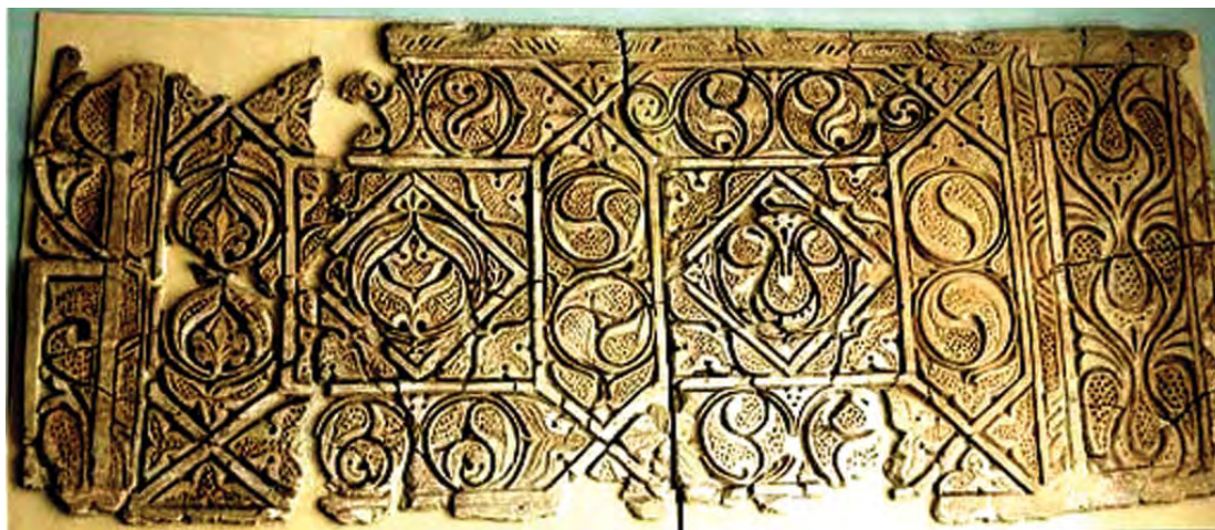
تصویر ۶. گچبری مکشوفه از سامرا، سبک (B)، نقوشی شبیه بته در سراسر تصویر دیده می‌شود؛ اما فاقد ویژگی‌های هویتی بته هستند.

تیبین ویژگی‌های نقش‌مایه‌بته‌باتوجه به نظریات و آراء پژوهشگران در باب اصل و منشأ آن در هنر اسلامی ونقدی بر نظرگاه درخت سرو به عنوان منشأ این نقش