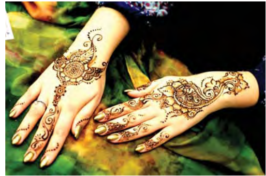
تصویر ۷. نقش بته یکی از نقوش رایج در میان نقوش حنا یا مهاندی است. در دست سمت راست تصویر بته نقش شده و در دست سمت چپ تصویر برگ گل شبیه بته به تصویر درآمده است.

کی ای ادالچی ۷ از جمله افرادی است که پژوهش مستقلی در خصوص نقش بته انجام داده است. وی در تأیید نظر پرهام در خصوص ارتباط هما و سرو به عنوان منشأ نقش بته، با اشاره به اینکه پرهام نمونه‌های سکایی و هخامنشی این نقش‌مایه را ارائه نکرده به جستجوی نقوشی در این خصوص پرداخته و نمونه‌هایی از قبل از اسلام این نقش به شکل برگ در پارچه‌های مکشوفه از اخمیم مصر ارائه کرده و به طور ضمنی به تاثیرگذاری فرهنگ ایرانیان در دورهٔ هخامنشی و ساسانی بر روی فرهنگ این منطقه در مصر اشاره کرده و سپس به ارائهٔ نمونه‌های دوران اسلامی به ویژه گچبری‌های نیشابور پرداخته است ۸ . او با اشاره به نظر فیونا مک لاک ۹ در خصوص منشأ بته