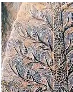
تصویر ۱۳. جزئی از تصویر شماره ۱۲

تیبین ویژگی‌های نقش‌مایه‌بته باتوجه به نظریات و آراء پژوهشگران در باب اصل و منشأ آن در هنر اسلامی و نقدی بر نظرگاه درخت سرو به عنوان منشأ این نقش