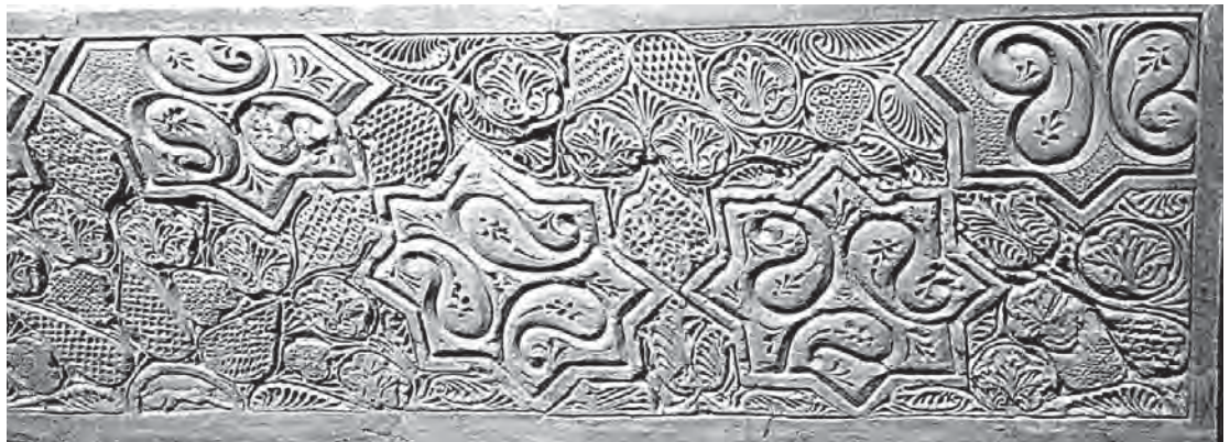
تصویر ۳. بخشی از تزیینات گچی دیوار مدرسه‌ای در ری، متعلق به سده پنجم هجری قمری با نقوش صنوبری و شبیه بته، محل نگهداری: بخش اسلامی موزه ملی ایران شماره ثبت اثر: ۳۳۶۷.

بته کوتاه شده واژه بوته است. بوته در لغت دارای معانی متعددی است. یکی از معانی ذکر شده در فرهنگ‌ها برای واژه بوته در ارتباط با این نقش‌مایه است: «رستنی و درخت پرشاخ و برگ که تنه نداشته باشد و از زمین زیاد بلند نشود. این لفظ را غیر فصحا در تکلم بته (بدون واو و با تشدید باء) گویند که در واقع غلط است و باید ترک کرد» (داعی الاسلام، ۱۳۶۲، ج ۱: ۷۶۵). دهخدا نیز معنای بته را چنین شرح می‌دهد: «بوته، گیاه کوتاه بالا. درخت کوتاه. هر گیاه که ساق محکم ایستاده ندارد. نباتی میان درختک