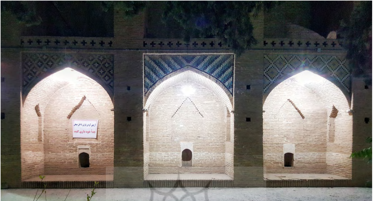
تصویر ۳. محل نشستن مردم دورتادور حیاط و پارچه اخطاردهنده برای جلوگیری از اتراق مردم در راستای سیاست‌های جدید، مقبره شاه نعمت‌الله ولی ماهان، عکس: سیده حسنا حسینی نسب، ۱۳۹۶.

مردمی و تفرجی ممانعت می‌شود. این در حالی است که این اماکن و سنت‌ها و نمادهایی که در آنها جاری است، میراث باارزش این مرزوبوم به شمار می‌روند. خوانش آنها نقش مهمی در شناخت فرهنگ و مردم داشته و تقویت و توسعه آن موجب تقویت فرهنگ غنی ایرانی است. پویایی و حضور فعال مردم در این مکان‌ها و تبدیل آنها به مقاصد تفرجی با دید غرورآمیز نسبت به تداوم یافتن این فرهنگ باارزش برداشت می‌شود (تصویر ۴).