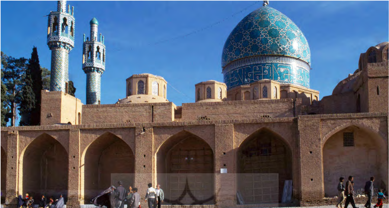
تصویر ۴. نمونه‌ای از انتراق مردم در رواق‌های اطراف مقبره و تفرج در کنار عمل زیارت/ مقبره شاه نعمت‌الله ولی ماهان

مکان مقدس بداند، بلکه باید آن را نمودی از باورها و اعتقادات برخاسته از فرهنگی بداند که ریشه در نیازهای مردم این سرزمین و هویت آنان دارد که علاوه بر ایجاد تعلق خاطر، به توسعه ابعاد اجتماعی و مشارکت‌های مردمی می‌انجامد و به جامعه نشاط و سرزندگی می‌بخشد.