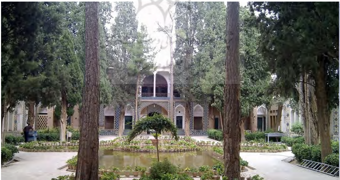
تصویر ۲. حیاط جلوی مزار با عناصر گزینشی و آرایش آن در راستا تأکید بر فضای معنوی، مقبره شاه نعمت‌الله ولی ماهان

وسعت این حوض، قرارگیری آن در برابر بنا و انعکاس نقش بنا در آب عملکردی جهت تقدس‌بخشی به بنا دارد و نقش سلسله‌مراتبی جهت ایجاد فضایی معنوی و حضور قلبی برای ورود به مزار این عارف را به خوبی ایفا می‌کنند. همچنین عناصر نمادین قرار گرفته در قسمت‌هایی از حیاط، سرعت حرکت در آن مسیر را کم و درنگ‌هایی ایجاد می‌کنند. عملکرد حیاط ورودی به علت برخورداری از جوهره فضاسازی موردپسند ایرانی‌ها و قرارگیری در کنار مکان مذهبی بستری برای بروز سنت