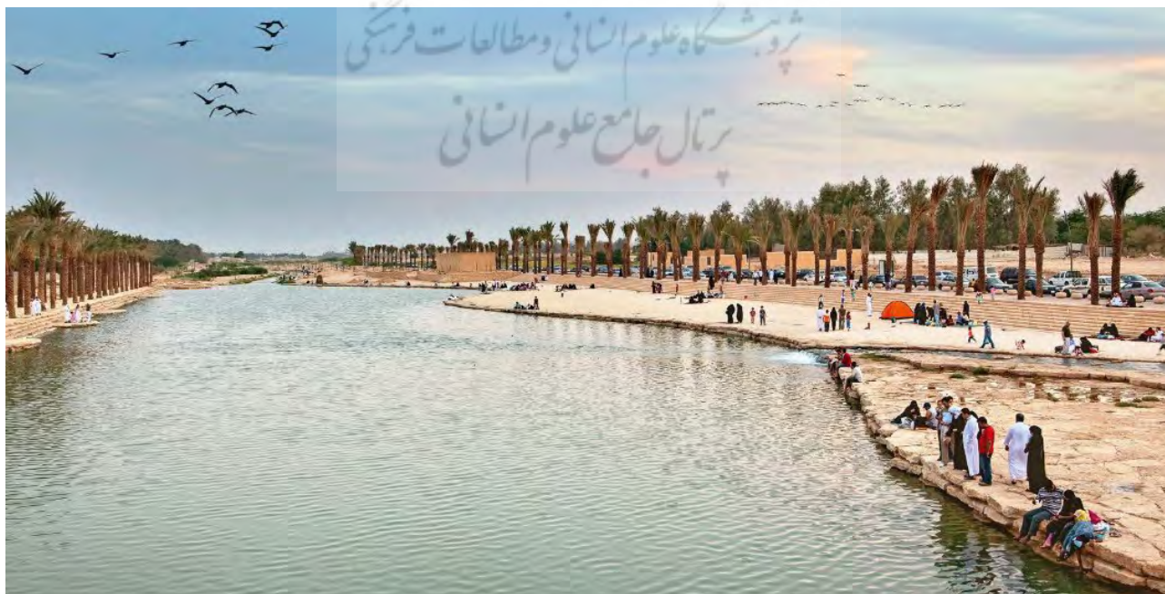
تصویر ۱: رودخانه وادی حنیفه.

پروژه رودخانه وادی حنیفه در کشور عربستان، به عنوان یک پروژه چالشی در عرصه معماری منظر و در برابر آشوب سیل قابل توجه است (تصویر ۱). این رودخانه شهری که از