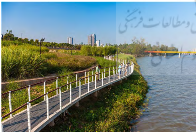
فصل خشک و کم آب

معمار منظر این پروژه با وجود آشوب سیل، رویکرد تاب‌آور را نسبت به آن اتخاذ کرده است. نکته اصلی در این پروژه، هماهنگی و سازگاری با سیل است که به جای مقاومت در برابر آن، سازگار و منطبق با آن ایجاد شده است. استفاده از راهبرد تالاب در این پروژه، آشوب سیل را به یک عنصر