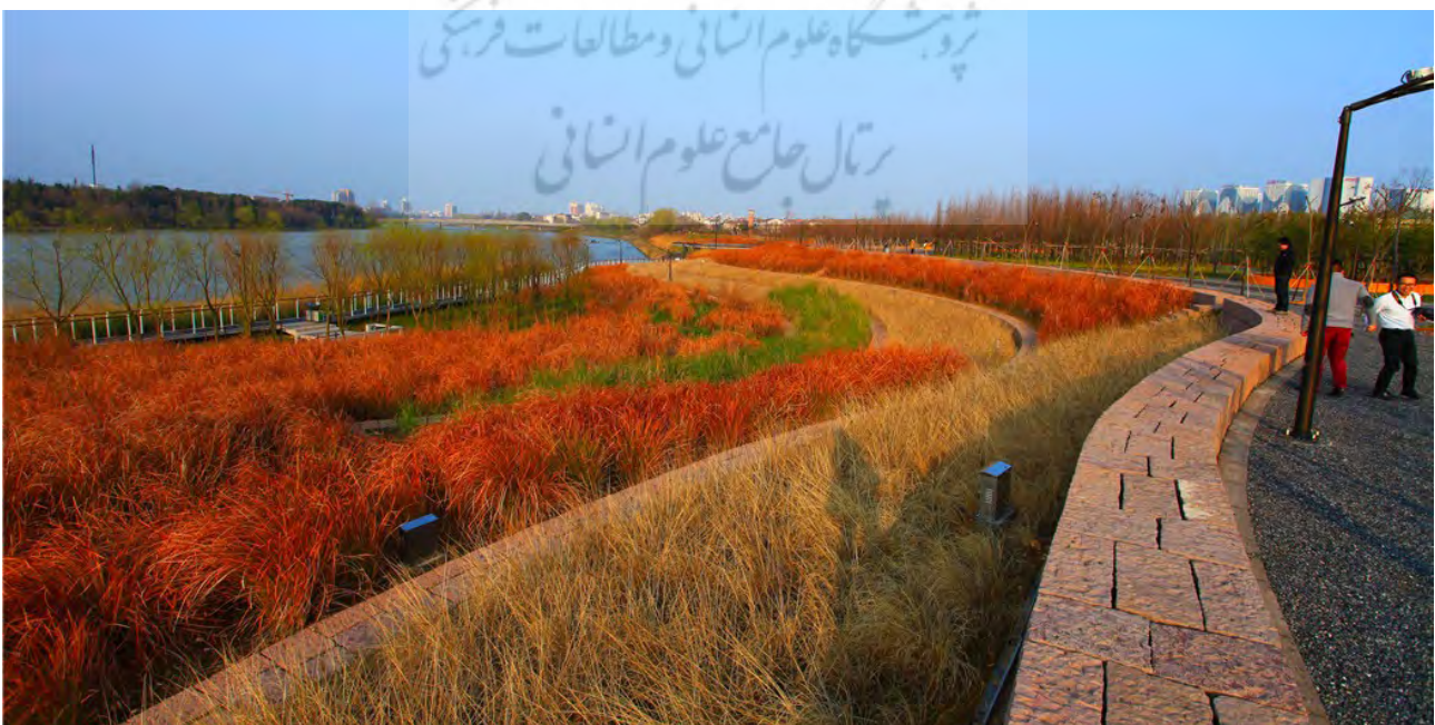
تصویر ۴: راهبرد صفه‌سازی در کران رود، ایجاد منظر کشاورزی، مهار سیل و نگاه‌هایی به رود.

و همگرایی دو رودخانه ووی ۱۵ و یوو ۱۶ قرار دارد که هر ساله سیل محیط و فضای با تلاقی و طبیعی آن را تهدید می‌کند. معمار منظر این پروژه، کینجوان یو، در راستای پاسخ به چالش‌ها و معضلات پروژه، چندین راهبرد را مطرح کرده است. سیل به عنوان اصلی‌ترین چالش این پروژه، سوژه اصلی طراحی است که معمار منظر آن به دنبال یافتن پاسخی در راستای سازگاری با آن است. علاوه بر سیل، چالش‌های متعدد منظرین دیگری نیز در این پروژه مدنظر بود که در این پژوهش تنها به راهکارهای مقابله با سیل پرداخته می‌شود. با توجه به شرایط آب و هوایی، این منطقه (جین هوآ) از سیل سالانه رنج می‌برد. از این رو، و همانند سایر رودخانه‌های جهان،