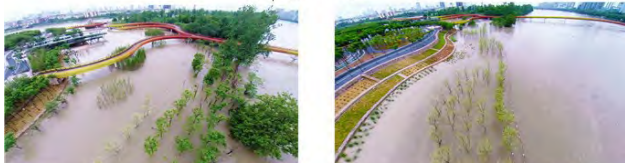
فصل سیل و پر آب

تصویر ۵: ایجاد تنوع فضایی و ارتفاعی در رود. استفاده از فضا در فصل‌های خشک و سیل‌خیز.