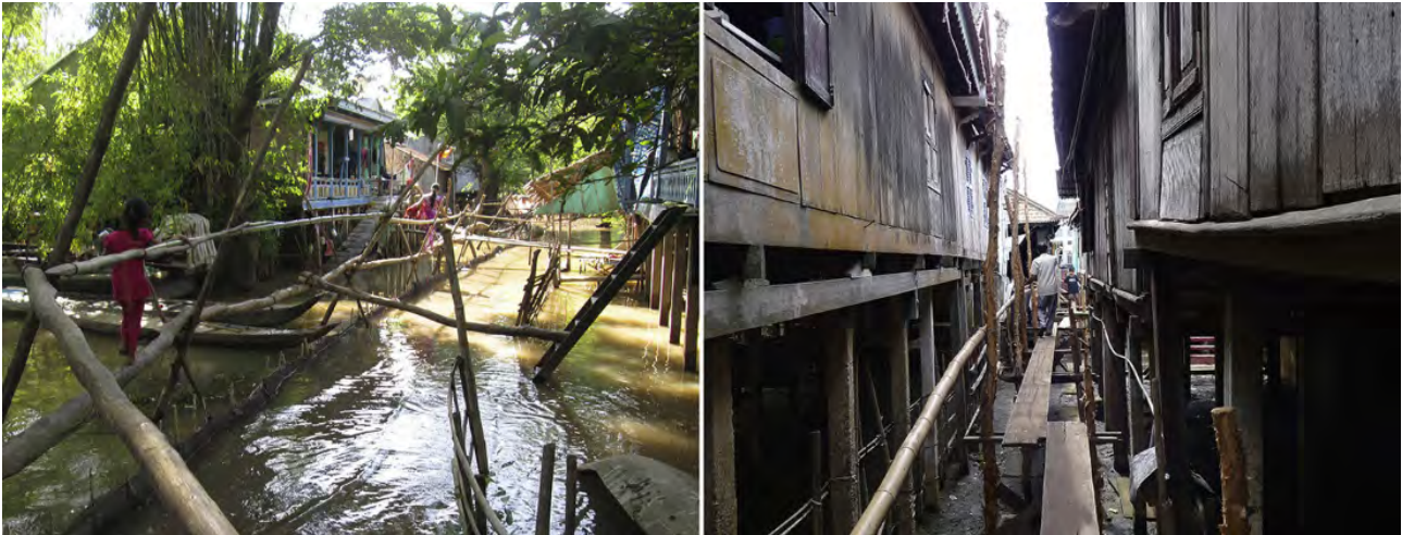
تصویر ۳: فضای «سن» در دو روستای دلتای مکنوگ در فصل سیل خیز. ایجاد معماری پیلوتی بروی سیل و استفاده حداکثری از سیل برای کشاورزی، ماهی‌گیری، شستشوی لباس و ظروف.

دیوارها و کانال‌های کنترل سیل به عنوان راهکار و راهبرد در برابر سیل استفاده می‌شده است که این امر ارتباط شهر و ساکنان را با رود مخدوش کرده بود. این رویکرد صلب و مهندسی باعث افزایش قدرت سیل و خسارات ناشی از آن نیز شده بود. در این راستا، معمار منظر این پروژه راهبرد متفاوتی را مطرح کرد که جایگزین کانال‌های کنترل سیل شد. معمار منظر این پروژه با به‌کارگیری راهبرد «صفه‌سازی در کران رود» ۱۷ تعادلی بین رود، لبه آن و محیط اطراف ایجاد کرد. این راهبرد به عنوان یک ابزار و رویکرد متفاوت، با شرایط محیطی و سیل سازگار و تاب‌آور است (تصویر ۴). این راهبرد با ایجاد تراس‌های مختلف و پی‌درپی در لبه رودخانه، ساختار رود را از کانال با دیوارهای بتنی به ساختاری طبیعی تغییر داده است