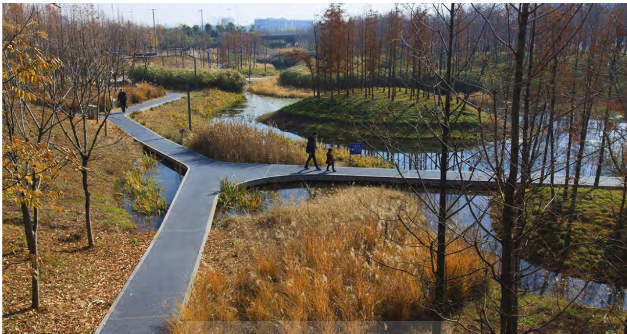
تصویر ۶. تالاب‌هایی برای پاکسازی آب و کاهش سرعت روان آب‌ها و سیل. معمار منظر، با ایجاد راه‌های ارتباطی بین آنان، باعث نزدیکی انسان به آب (نظر به طبیعت) شده است.