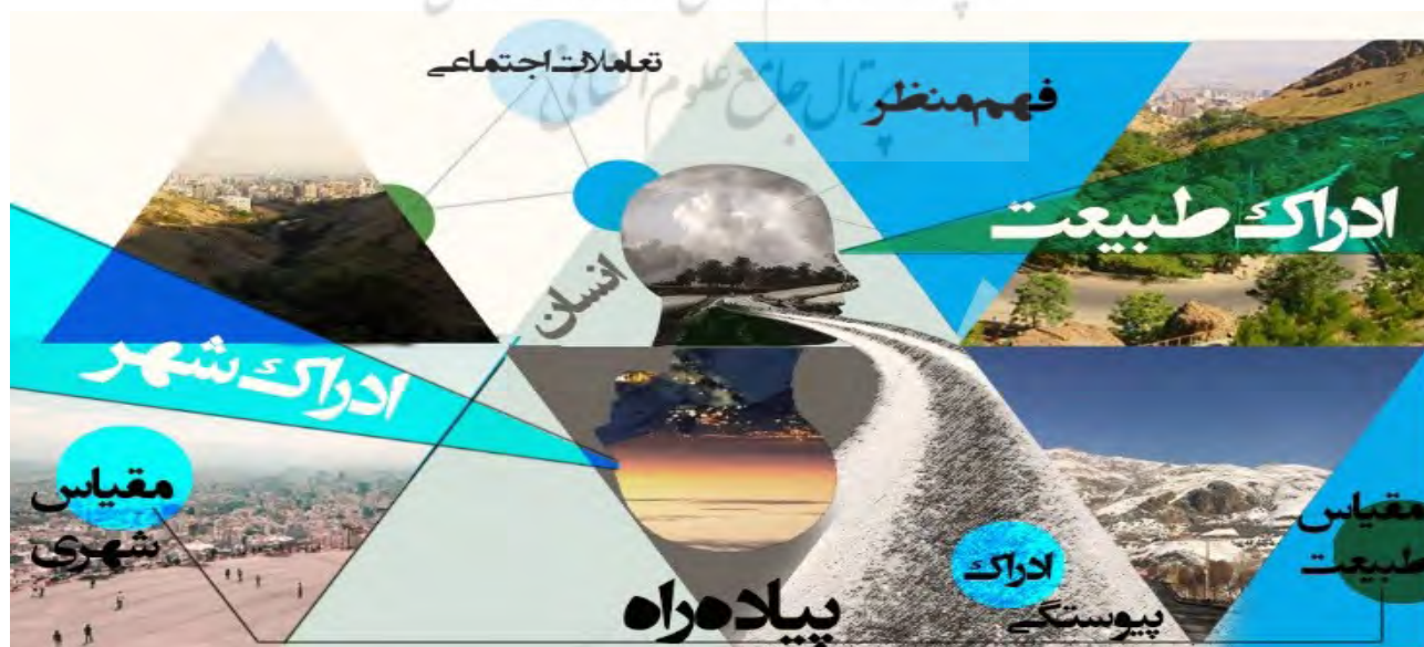
تصویر ۷: روند ادراک منظر پیاده‌راه بام تهران در ذهن انسان و شکل‌گیری کاراکتر فضا.

اجتماعی ناشی از تعاملات اجتماعی در فضای جمعی آن منجر به شکل‌گیری یک کاراکتر طبیعی-اجتماعی شده‌است. این هویت التقاطی در مسیر انتهایی بام تهران (تراس) یک فضای جمعی را با بالاترین تعاملات اجتماعی در کنار بالاترین تعاملات طبیعت‌گرایانه (فاعلی-مفعولی) شکل داده است. در این فضا تفسیری مدرن از شهر تهران بر یک بستر طبیعی رخ می‌دهد و شناخت منظر پیاده‌راه از طریق هویت‌ها و نمادهای آن صورت می‌گیرد. در واقع پیاده‌راه بام تهران همچون یک عامل پیوند دهنده عمل کرده و با حرکت انسان در این