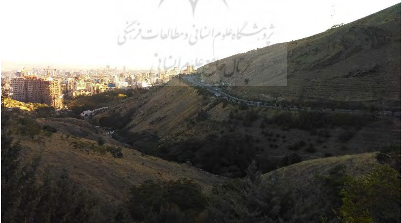
تصویر ۳: پیوستگی منظر طبیعی بام تهران و شهر تهران. عکس: فرزنان حاجی رضایی، ۱۳۹۷.

گردشگری و تفریح در واقع جوابی است به نیازهای درونی انسان که زمینه ارتقاء فکری، انبساط خاطر و تخلیه روحی و روانی او را فراهم می‌کند. همان‌گونه که انسان به پرورش جسم نیازمند است، به تفریح سالم نیازمند است تا بدین شکل بتواند به آرامش روحی و فکری برسد (غضنفری و جوادی، ۱۳۸۸). امروزه با توجه به هدف و انگیزه سفر، طیف وسیعی از گردشگری همچون: گردشگری تاریخی، طبیعی، زیارتی، آیینی و... شکل گرفته‌است. در این بین مسیر کوهستانی بام تهران در دامنه رشته کوه‌های البرز به عنوان لبه منظرین تهران از اهمیت بالایی برخوردار است. در این مسیر پیاده غالب فعالیت‌ها معطوف به معرفی مکان‌های طبیعی بکر و دست‌نخورده و ارائه برنامه‌های گردشگری