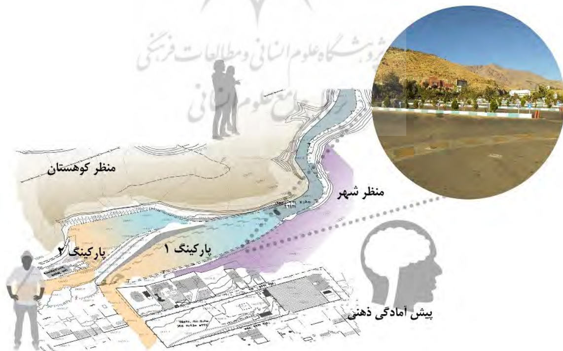
تصویر ۴: ادراک در مرحله یک، پیش‌آمادگی ذهنی.

در انتهای خیابان ولنجک مسیر پیاده بام تهران از پارکینگ شروع می‌شود. مخاطب در این مسیر از ورودی تا ابتدای پیاده‌راه سلامت به یک ادراک کلی از فضای بین شهر و طبیعت می‌رسد. این فضا همچون فضایی میان‌دار و مرز بین شهر و طبیعت است. مخاطب به تدریج از شهر دور شده و پا به عرصه طبیعت می‌گذارد. در واقع مخاطب با یک پیش‌آمادگی ذهنی به سمت مسیر پیش می‌رود. در این مرحله ادراک به صورت شناخت کلی فضا، هندسه فضا و دریافت کلیات است (تصویر ۴).