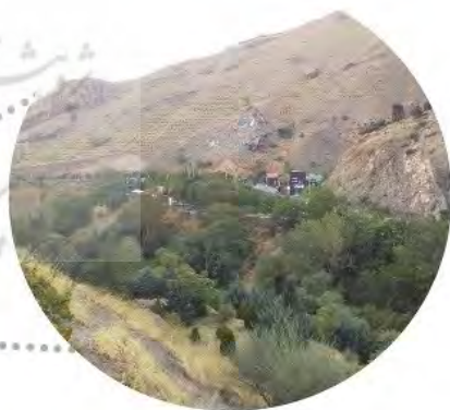
تصویر ۵: ادراک در مرحله دو، ادراک از طریق مواجهه.