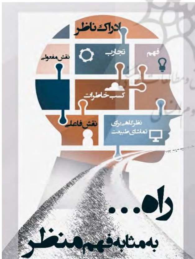
تصویر ۱: راه به مثابه فهم منظر.

زندگی شهری در طول تاریخ همواره با تعامل سازنده میان مخاطبان تعریف می‌شود و روابط شهروندان با یکدیگر باعث ارتقای زندگی جمعی در شهر بوده است. زندگی پیاده بستری مناسب برای ایجاد این تعاملات فراهم می‌آورد. در این میان پیاده‌راه به دلیل ویژگی ذاتی خود در ایجاد تعاملات اجتماعی از نقش اساسی برخوردار است. مدنی‌پور یکی از ویژگی‌های شهر خوب را شهر قدم زدن و مکث کردن می‌داند، شهری که فضای شایسته، منسجم و به دور از ازدحام برای قدم زدن دارد (مدنی‌پور، ۱۳۹۱). برقراری تعاملات اجتماعی از مهم‌ترین شاخص‌های فضاهای جمعی، امری است که به واسطه همین پیاده‌روها امکان‌پذیر است. احداث پیاده‌راه‌ها می‌تواند در ثبت و ارتقای حیات مدنی مراکز شهر مؤثر باشد. طبق نظر «کریستوفر الکساندر»، خیابان‌های شهر صحنه‌ی رویارویی اجتماعی است، خیابان زمینه‌ی تعامل میان گروه‌های مختلف را فراهم می‌آورد که این خود باعث نظم اجتماعی