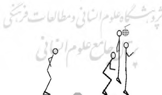
شکل ۲- تکلیف پرش- فرود ویژه فوتبال