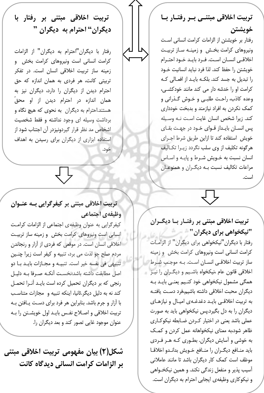
شکل (۲) بیان مفهومی تربیت اخلاقی مبتنی بر الزامات کرامت انسانی دیدگاه کانت