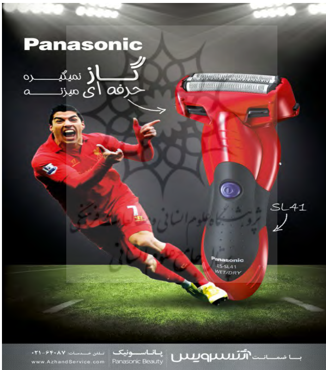
نمونه 1: تصویر سوارز در بیلبرد تبلیغاتی پاناسونیک در ایران

جام جهانی 2014 شانه جورجو کیهلینی، مدافع تیم ملی ایتالیا را گاز گرفت و به یکی از خبرسازترین موضوعات رسانه ای در خلال جام جهانی برزیل، تبدیل شد. در تبلیغات محصولات پاناسونیک در ایران این شعار درج شده بود که: «گاز نمیگیره، حرفه ای میزنه». در حقیقت نگاهی است با چاشنی طنز به رفتار غیرحرفه ای سوارز و گاز گرفتن وی در خلال یک بازی حرفه ای فوتبال. بالواقع در این تبلیغ با استفاده از فن همجواری و تصور ذهنی که استفاده از این ریش تراش به هنگام اصلاح، موجب خراش و گازگرفتگی صورت نمی شود ولی در عین حال به صورت کاملاً حرفه ای و دقیق عمل می کند، تلاش دارد که سوارز را در نقش دال و جسارت نامتعارف و سنت شکنی را به عنوان مدلول برای کالای مورد نظر القاء کند.