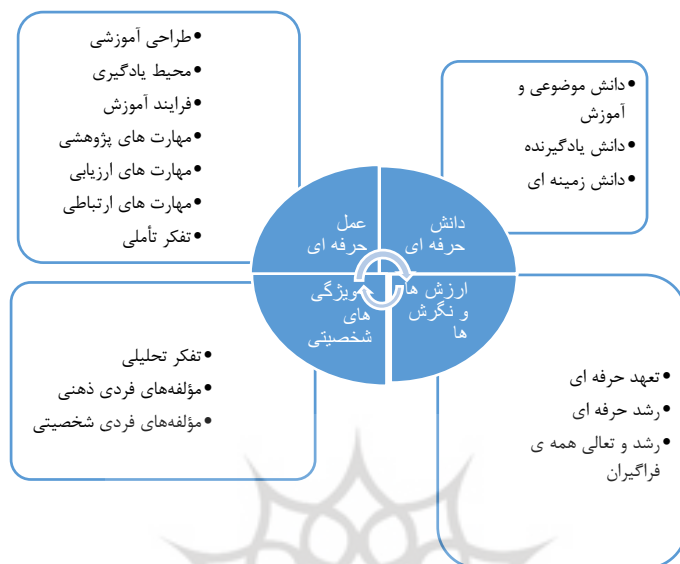
تصویر ۲: چارچوب مفهومی شایستگی‌های حرفه‌ای معلمان ابتدایی

شواهد مطالعاتی نشان می‌دهد شایستگی حرفه‌ای معلمان حاصل کسب دانش و مهارت‌های حرفه‌ای این حوزه و برخورداری معلم از ویژگی‌های شخصیتی و نگرشی است. به طوری که این ویژگی‌ها در قالب ابعاد مختلف و به صورت یک کل یکپارچه در رفتار فرد نمود پیدا کند. در