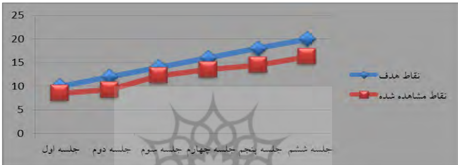
نمودار ۱- نمودار CBM بر اساس نقاط مشاهده شده (میانۀ نمرات دانش‌آموزان) و هدف بعد از شش جلسه

دو نمونه از نمودارهای CBM حاصل از پژوهش حاضر در نمودارهای شماره ۱ و ۲ ملاحظه می‌شوند (به منظور مطالعه جزئیات دستورالعمل اجرای CBM برای درس ریاضی به رایت (۱۹۹۲) و لمبکه و استکر (۲۰۰۷) مراجعه کنید).