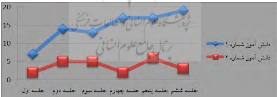
نمودار ۲- نمودار CBM بر اساس نقاط مشاهده شده برای دو دانش‌آموز با پیشرفت ریاضی متفاوت