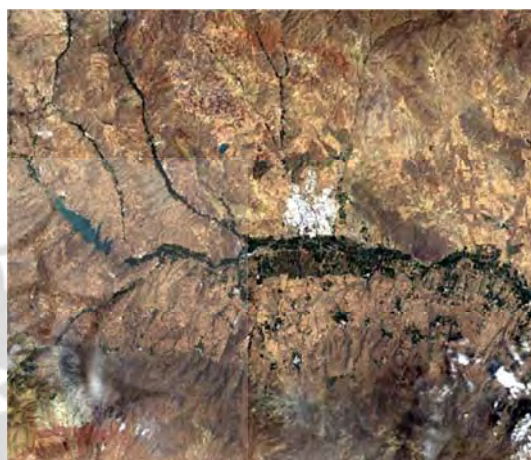
شکل ۱. تصویر سنجنده OLI ماهواره LANDSAT 8 به کاررفته در تحقیق، با ابعاد ۱۰۰۰ در ۱۰۰۰ پیکسل

در محدوده طول جغرافیایی بین 46^{\circ}47'31'' تا 47^{\circ}7' 42'' شرقی و عرض جغرافیایی 38^{\circ}19'24'' تا 38^{\circ}35' 58'' شمالی قرار دارد. این تصویر در تاریخ 2015/07/17 میلادی دریافت شده است. اندازه زمینی پیکسل این تصویر حدود ۳۰ متر و با تعداد ۹ باند است که از باندهای شماره ۲، ۳، ۴، ۵ و ۶ برای محاسبات در این تحقیق استفاده شد. شکل ۱ نمونه تصویر مورد استفاده را نشان می‌دهد.