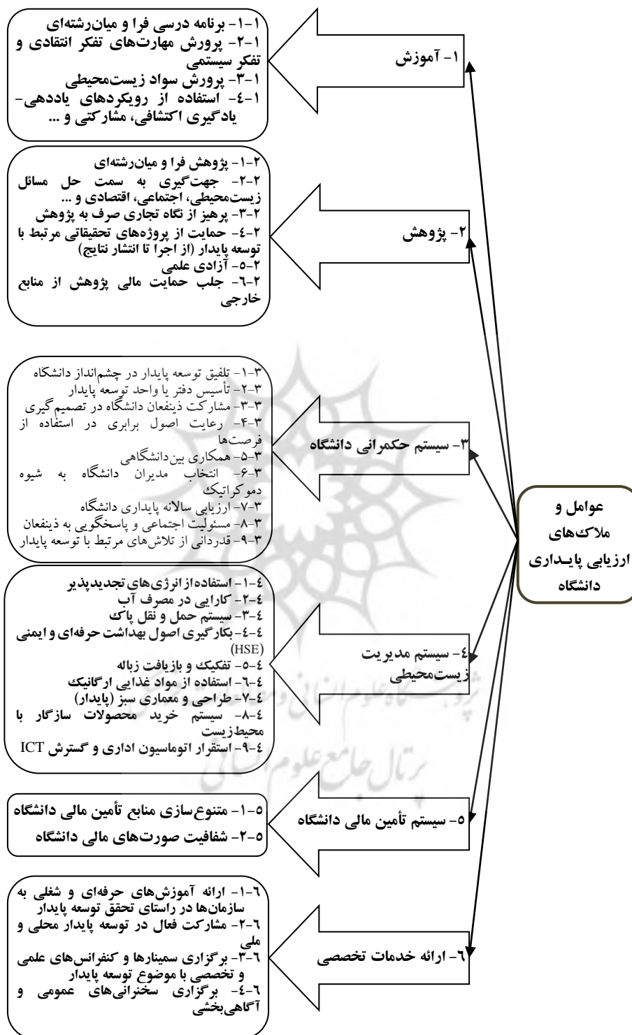
شکل ۲. عوامل پایداری دانشگاه و ملاک‌های مربوط به