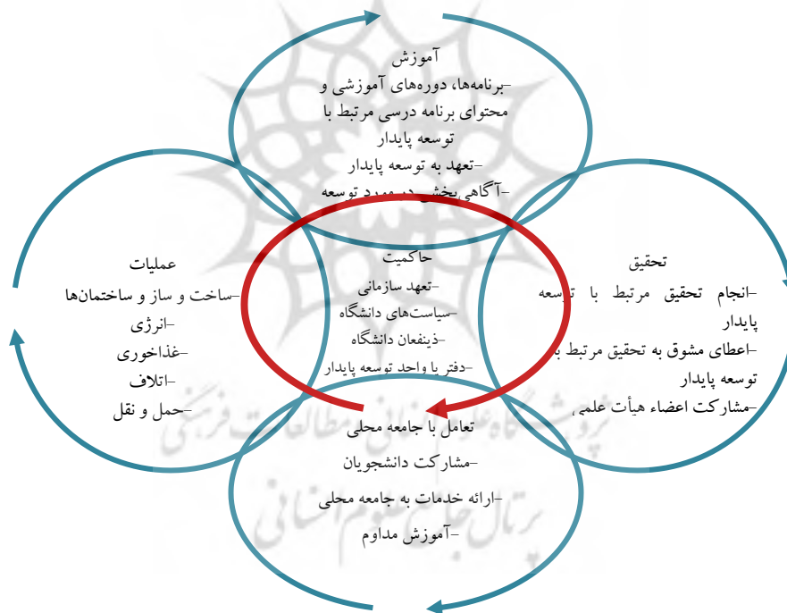
شکل ۱. حوزه‌های ارزیابی پایداری مؤسسات آموزش عالی (منبع: کمال و آسموس، ۲۰۱۳)

کمال و آسموس ۱ (۲۰۱۳) چهار ابزار ارزیابی پایدار مؤسسات آموزش عالی که بیشترین کاربرد در آمریکا و کانادا دارند را برای بررسی و مطالعه جامع خود انتخاب نموده‌اند، که عبارت‌اند از: ۱) پرسشنامه ارزیابی پایداری، ۲) چارچوب ارزیابی پایداری پردیس دانشگاهی ۲ ، ۳) کارت گزارش‌دهی پایداری دانشگاه ۳ و ۴) سیستم ردیابی، ارزیابی و درجه‌بندی پایداری ۴ . به عقیده آن‌ها موارد یک و دو آموزشی و آکادمیک محور ۵ هستند در حالی که موارد سه و چهار جنبه‌های آموزش عالی را ورای مقوله‌های آموزشی و آکادمیک مدنظر دارند. آن‌ها پنج حوزه اصلی را برای ارزیابی پایداری دانشگاه‌ها شناسایی کرده‌اند که عبارت‌اند از: آموزش، تحقیق، تعامل با جامعه محلی، عملیات و حاکمیت. حوزه‌های پنج‌گانه و هریک از نشانگرهای آن‌ها در شکل ۱ قابل مشاهده هستند.