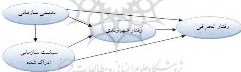
شکل ۱. مدل مفهومی پژوهش

حال، با توجه به روابط عنوان شده در مبانی پژوهش، الگوی مفهومی (۱) برای بررسی تأثیر بدینی سازمانی بر رفتار انحرافی از طریق متغیرهای میانجی ادراک سیاست سازمانی و رفتار شهروندی طراحی شده است.