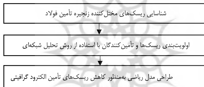
شکل ۱. مراحل انجام پژوهش

در این بخش با توجه به پیشینه پژوهش، ابتدا مهم‌ترین ریسک‌هایی که شرکت فولاد با آن مواجه است از طریق مصاحبه با خبرگان شناسایی و با روش فرآیند تحلیل شبکه‌ای اولویت‌بندی می‌شود؛ سپس اقدام به حداقل‌سازی آن‌ها از طریق ساخت مدل ریاضی خواهد شد. این مراحل به‌صورت خلاصه در شکل ۱، آورده شده و در ادامه به تفصیل توضیح داده شده است.