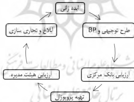
شکل ۱. فرآیند توسعه خدمات جدید در بانک

کدگذاری محوری و گزینشی. در این جا مقوله‌های جدا از هم در چهارچوبی معنادار کنار یکدیگر قرار خواهند گرفت و روابط میان آن‌ها به‌ویژه رابطه مقوله محوری با سایر مقوله‌ها، مشخص خواهند شد. در ابتدا فرآیند توسعه خدمت جدید در نظام بانکی ارائه و سپس الگوی پارادایمی نمایش داده می‌شود. بر اساس تحلیل محتوا و کدگذاری مصاحبه‌ها فرآیند شش مرحله‌ای توسعه خدمات جدید در قالب نگاره زیر شناسایی شد.