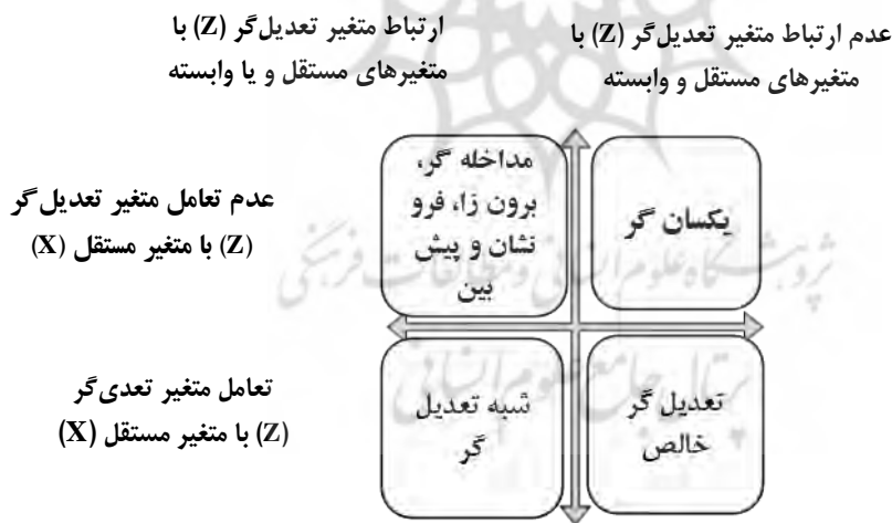
شکل ۳. انواع متغیرهای تعدیل‌گر (عزیزی، ۱۳۹۲)