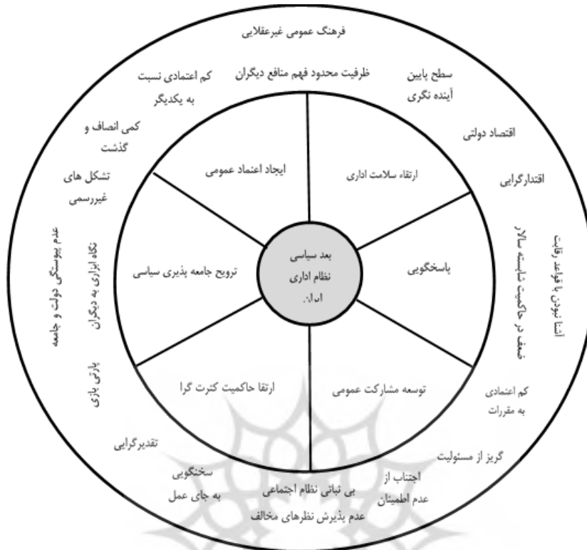
شکل ۱. مدل مفهومی پژوهش

سؤال سوم پژوهش: حد بهینه بُعد سیاسی نظام اداری ایران در وضعیت موجود و مطلوب به چه اندازه است؟