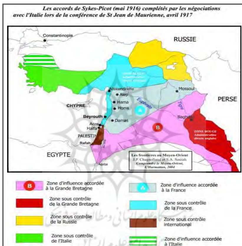
نقشه ۱- تقسیم امپراتوری عثمانی بر اساس موافقت‌نامه‌ی سایکس - پیکو (۴)

خودی خود شکل نگرفته بود، بلکه این قیمومت بر واحدهای یکپارچه‌ی جغرافیایی که قرن‌ها پیش در درون امپراتوری عثمانی شکل گرفته بود اعمال شد. افزون بر این، جوامع کُرد و عرب روابط تجاری و اجتماعی گسترده‌ای با یکدیگر داشتند که یکپارچگی درونی بسیاری به عراق می‌بخشید (Gallaher et al, 2011: 107).