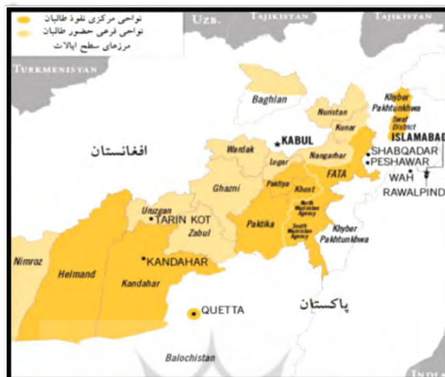
نقشه ۱- نواحی نفوذ و حضور طالبان در مناطق مرزی پاکستان و افغانستان

http://www.nctc.gov/site/groups/afghan_taliban.html