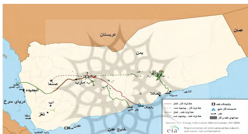
نقشه ۲- میدین نفت و گاز، خطوط لوله، پالایشگاهها و بنادر صادراتی نفت و گاز یمن

به‌طوری که منابع و میدانهای نفتی عموماً در خارج از قلمرو زیست‌زیدی‌ها قرار دارد ولی در عوض بخشی از خطوط لوله انتقال نفت در قلمرو آنهاست. پالایشگاههای نفت کشور نیز خارج از قلمرو زیدی‌ها است. فعالیتهایی مثل کشاورزی نیز به‌طور عمده در مناطق زیدی نشین بوده ولی فعالیتهای مرتبط با ماهیگیری در بنادر جنوبی مستقر است. این نوع پراکنش منابع و فعالیتهای اقتصادی موجب پیچیده شدن روابط در یمن شده و مانع غلبه کامل سیاسی و اقتصادی یک گروه بر گروه دیگر می‌شود. نقشه شماره ۲ میدین نفت و گاز و خطوط لوله و پالایشگاهها و همچنین بنادر صادراتی نفت و گاز را نشان می‌دهد.