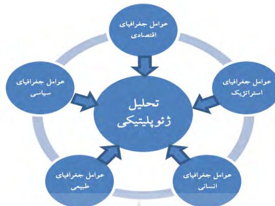
شکل ۱- عناصر تحلیل ژئوپلیتیک

توجه شود. اگر چه ممکن است در همه تحلیل‌ها همه عوامل نقش نداشته باشند. شکل شماره ۱ عناصر تحلیل ژئوپلیتیک را نشان می‌دهد.