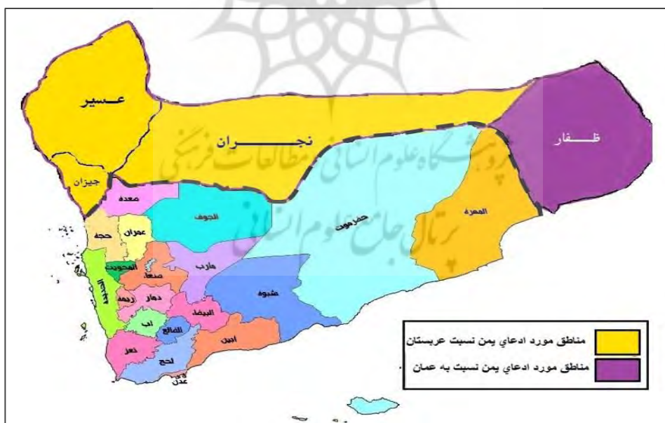
نقشه ۳- ادعاهای ارضی یمن نسبت به عربستان و عمان

است، به طوری که شامل دو سوم جنوب آن کشور می‌شود. عربستان سعودی ادعا کرده است که مناطق نفت خیز یمن مانند «مأرب»، «جوف»، «ربع الخالی» و «حضر موت» متعلق به آن کشور است. به علت وجود اختلاف بر سر مناطق مذکور، مرزهای بین عربستان سعودی و یمن تاکنون نه روی نقشه و نه روی زمین تحدید نشده است (Jafari Valadani, 1993: 49). همچنین بند ۵ پیمان طائف می‌گوید هیچ دیوار یا استحکامات مرزی نباید در امتداد خط مرزی کشیده شود. عربستان سعودی با ادعای افزایش قاچاق، پروژه فَنس‌کشی را در سال ۲۰۰۳ در امتداد مرزهای خود شروع کرد که با اعتراض یمن ساخت دیوار و فنس تا حدودی متوقف شد (Saber, 2015; 2-9). به طور کلی مردم یمن هرگز حاضر نشدند واگذاری عسیر به عربستان سعودی را بپذیرند به همین جهت پس از امضای معاهده طایف امام یحیی توسط کسانی که مخالف واگذاری عسیر به عربستان سعودی بودند کشته شد و فرزندش امام بدر جانشین وی گردید (Nyrop, 1977: 27). آنچه در گذشته سبب شده که دو کشور در صدد تحدید مرزهای خود برنایند، فقدان فعالیت‌های اکتشافی در مناطق مرزی بوده است. قبلاً شرایط سخت طبیعی مانع از کاوش در این مناطق شده بود و ضرورتی هم برای تحدید مرزها احساس نمی‌شد. نقشه شماره ۳ ادعاهای ارضی یمن نسبت به سه استان در عربستان و یک استان در عمان را نشان می‌دهد.