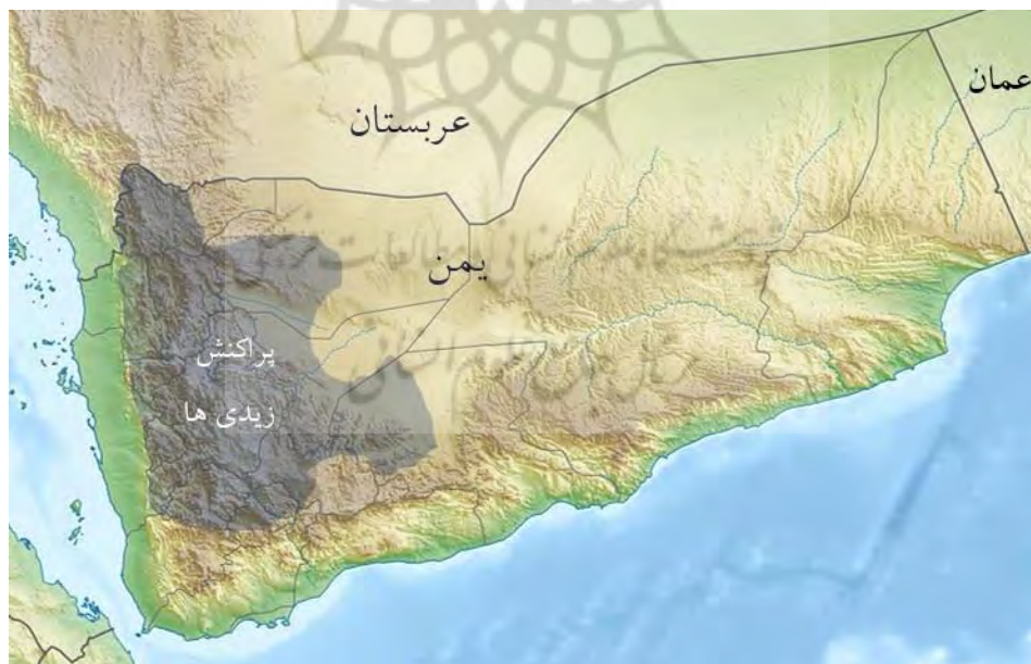
نقشه ۱- همپوشانی تنوعات توپوگرافیکی یمن با تنوعات انسانی (مذهبی)

گذشته نیز تجربیات سیاسی متفاوتی را از سر گذرانده‌اند که از جمله آن تقسیم این دو بخش به دو واحد سیاسی مستقل از هم بود. بخش‌های کوهستانی یمن به دلیل صعب‌العبور بودن، کمتر مورد تعرض قرار گرفته و بافت اجتماعی آن نیز یکدست‌تر می‌باشد ولی بخش‌های هموار و بویژه دشتهای ساحلی تحت تأثیر فرهنگ و ارتباطات مختلف بوده است و حتی خلق و خوی انسانها نیز با قسمتهای کوهستانی عموماً متفاوت است. جغرافیای طبیعی این کشور باعث شده حتی با وجود اینکه نزدیک به ۳۰ سال از اتحاد یمن شمالی و جنوبی می‌گذرد، هنوز جریانهای ناحیه‌گرایی در هر دو بخش کوهستانی و دشتهای ساحلی قوی است و بخصوص در بخش‌های زیادی از یمن جنوبی سابق به مرکزیت شهر عدن جنبش جدایی طلبی از شمال با قدرت زیادی فعال است. عوامل جغرافیای طبیعی در سالهای پس استقلال نیز مانع از ادغام مردم یمن در قالب یک ملت واحد شده و فرایند ملت‌سازی را با اختلال جدی روبرو کرده است و امروزه نیز بخشی از درگیری‌های این کشور حاصل نقش عوامل جغرافیای طبیعی است. نقشه شماره ۱ جغرافیای طبیعی و زمینه‌سازی این عوامل برای تنوعات انسانی این کشور را نشان می‌دهد. همچنانکه مشخص است تنوعات انسانی این کشور بویژه از جنبه مذهبی تا حد بسیار زیادی با تنوعات توپوگرافیک آن همخوانی دارد.