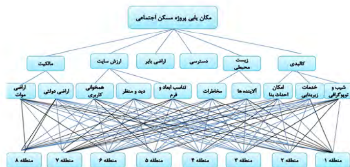
شکل ۲ - درخت سلسله مراتبی مکان‌یابی سایت احداث مسکن اجتماعی شهر قم

با توجه به شکل (۲) این پژوهش سعی دارد تا با توجه به شش معیار مالکیت، ارزش سایت، دسترسی، کالبدی، زیست محیطی و اراضی بایر و زیرمعیارهای مربوط به هر یک از آنها در مناطق هشت‌گانه شهر قم، به مکان‌یابی سایت احداث پروژه‌های مسکن اجتماعی اقدام گردد. در جدول ۱ برای ایجاد ماتریس مقایسه دوتایی از طریق غربال کردن که مقادیری از ۹ تا ۱ را برای تعیین میزان الویت‌های نسبی دو معیار به کار گرفته، استفاده شده است (هادیانی و کاظمی‌زاد، ۱۳۸۹: ۱۰۶).