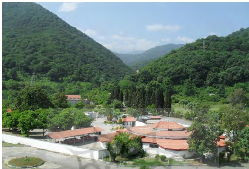
شکل شماره (۳): عکس از نمای آبگرم هتل، (منبع: میرتقیان، ۱۳۹۱: ۱۵)