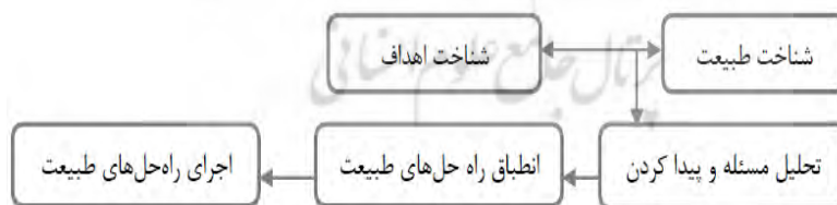
نمودار ۲- مراحل طراحی بیونیک

طراحی بیونیک دارای یک روند سیستماتیک است که انجام آن نیازمند شناخت دقیق از طبیعت، ساختارهای زیستی، نوع هم نشینی و ارتباط جانداران با یکدیگر و با محیط اطرافشان و شناخت از اهداف طراحی می باشد. طراح کار را با مشخص کردن اهداف شروع می کند و با توجه به اینکه شباهت و همانندی یک قاعده اصلی در بیونیک است، بدنبال سیستم هایی با عملکرد مشابه در طبیعت می گردد و در صورت مناسب بودن، ویژگی ساختاری سیستم بیولوژیکی را به سیستم فنی ای که می بایست گسترش یابد، انتقال می دهد. این روند سیستماتیک که در زمان انجام طراحی بیونیکی طی می شود در زیر آورده شده است: (نمودار ۲)