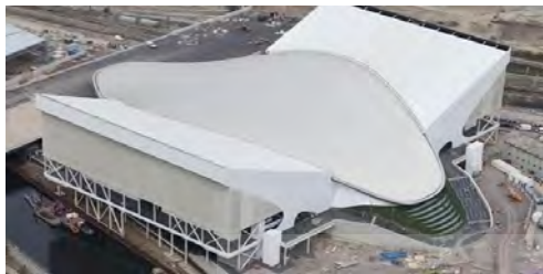
شکل ۳: طرح المپیک لندن

المپیک آبی لندن: ایده اولیه: شکل موج های آب رودخانه تیمز لندن طراح: زاها حدید (اشرفی و همکاران، ۱۳۹۴)