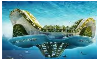
شکل ۲: طرح شهر شناور