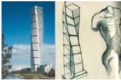
شکل ۲: طرح الهام از اندام انسانی

آثار سانتیگو کالاترا که با الهام از آناتومی انسان طراحی شده: برج تورینگ، توروسو، موزه هنر سیلواکی، شهرک علوم و فنون و دیگر آثار این سبک.