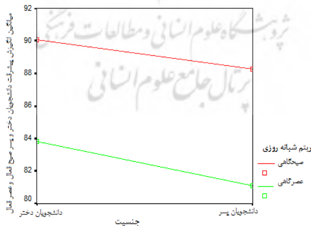
شکل ۲. مقایسه میانگین انگیزش پیشرفت بر اساس جنسیت و ریتم شبانه‌روزی

نتایج آزمون تحلیل واریانس دو طرفه نشان داد اثر اصلی ریتم شبانه‌روزی در آزمودنی‌ها معنادار است ( p=۰/۰۰۱ ). مقایسه میانگین‌ها نشان داد انگیزه پیشرفت در دانشجویان با ریتم سیرکادین صبحگاهی بهتر از دانشجویان با ریتم سیرکادین عصرگاهی ( M=۸۹/۱۸ ) است. اثر اصلی جنسیت معنادار نمی‌باشد ( p=۰/۲۵ ). مقایسه میانگین‌ها نشان داد انگیزش پیشرفت در دختران ( M=۸۶/۹۵ ) بهتر از پسران ( M=۸۴/۶۳ ) است. اثر تعاملی جنسیت در ریتم سیرکادین معنادار نمی‌باشد ( p=۰/۸۱ ). نتایج مقایسه میانگین‌ها نشان داد دختران با ریتم سیرکادین صبحگاهی بهترین میانگین انگیزه پیشرفت ( M=۹۰/۰۸ ) و پسران با ریتم سیرکادین عصرگاهی ضعیف‌ترین انگیزه پیشرفت ( M=۸۱/۰۹ ) را دارند (نمودار ۲).