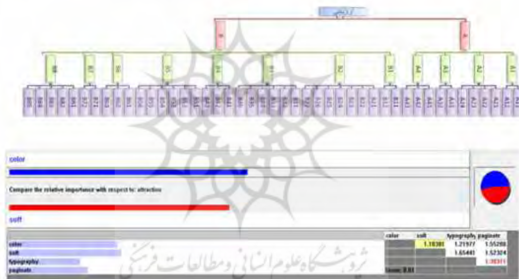
جدول ۲- نتایج حاصل از نرم‌افزار Expert Choice 12