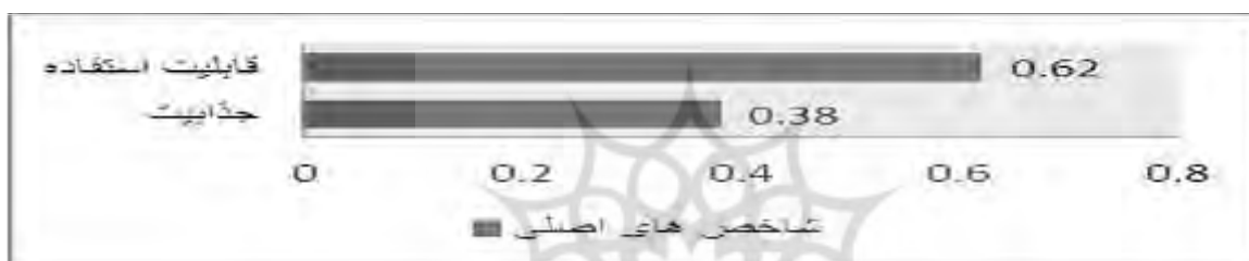
نمودار ۱- وزن شاخص‌های اصلی

نتایج حاصل از نمودار شماره یک نشان می‌دهد که جذابیت ۰/۳۸ و قابلیت استفاده ۰/۶۲ وزن ارزیابی را به خود اختصاص داده است. در جدول سه نتایج کلی وزن زیر شاخص‌ها نشان می‌دهد که انسجام وبسایت بالاترین رتبه و تعامل کمترین رتبه را در بین شاخص‌های ارزیابی به خود اختصاص داده است.