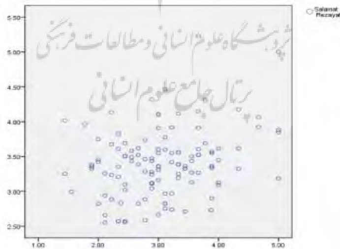
شکل ۱ - توزیع پراکندگی همبستگی سلامت سازمانی با رضایت شغلی معلمان تربیت‌بدنی