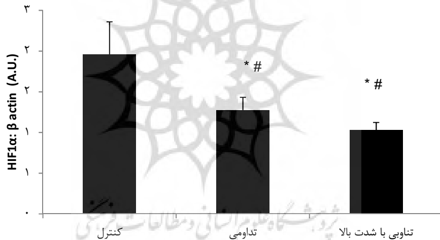
شکل ۲- میانگین و انحراف معیار پروتئین HIF-1 در چربی احشایی موش‌های چاق

نتایج تجزیه و تحلیل آماری حاصل از آزمون تحلیل واریانس یک سویه نشان داد که میان سطوح TNF- در بافت چربی احشایی موش‌های چاق در بین سه گروه تحقیق تفاوت معنادار وجود دارد (P = 0.004 و F_{2,6} = 16.376 ). با مراجعه به نتایج آزمون تعقیبی مشخص شد که بین گروه کنترل و گروه‌های فعالیت ورزشی (P=0.000) و همچنین بین گروه فعالیت تداومی و HIIIE (P=0.000) تفاوت معنادار وجود دارد و یک جلسه فعالیت تداومی یا HIIIE منجر به کاهش سطوح TNF- در بافت چربی احشایی موش‌های چاق شد. همچنین میزان کاهش در گروه تداومی بیشتر از HIIIE بود (شکل ۳). سطوح HIF-1 و TNF- در بافت چربی زیرپوستی در تحقیق حاضر قابل اندازه‌گیری نبود که ممکن است ناشی از خطای نمونه‌برداری و یا غلظت بسیار پایین این پروتئین‌ها در بافت چربی زیرپوستی حیوانات در این تحقیق باشد.