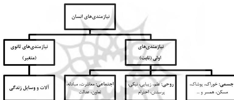
شکل ۲. دسته‌بندی نیازمندی‌های انسان از دیدگاه شهید مطهری

نیازمندی‌های ثانوی ناشی از توسعه و کمال زندگی هستند و در عین حال محرک به‌سوی توسعه بیشتر و کمال بالاترند. تغییر نیازمندی‌ها و نو شدن و کهنه شدن آنها به نیازمندی‌های ثانوی مربوط است. نیازمندی‌های اولی نه کهنه می‌شود و نه از بین می‌رود؛ همیشه زنده و نو است. پاره‌ای از نیازمندی‌های ثانوی نیز چنین است. از آن جمله است نیازمندی به قانون. نیازمندی به قانون ناشی از نیازمندی به زندگی اجتماعی است و در عین حال دائم و همیشگی است. بشر هیچ زمانی بی‌نیاز از قانون نخواهد شد. یک قانون اساسی اگر مبنا و اساس حقوقی و فطری داشته باشد، از یک دینامیسم زنده بهره‌مند باشد، خطوط اصلی زندگی را رسم کند و به شکل و صورت زندگی که وابسته به درجه تمدن است پردازد، شاید با تغییرات زندگی هماهنگی کند، بلکه رهنمون آنها باشد. قانون هر اندازه کلی و معنوی باشد و توجه خود را نه به شکل‌های ظاهری اشیا بلکه به روابط میان اشیا یا میان اشخاص معطوف کرده باشد، شانس بقا و دوام بیشتری دارد (مطهری، ۱۳۸۰: ۴۹ - ۵۲).