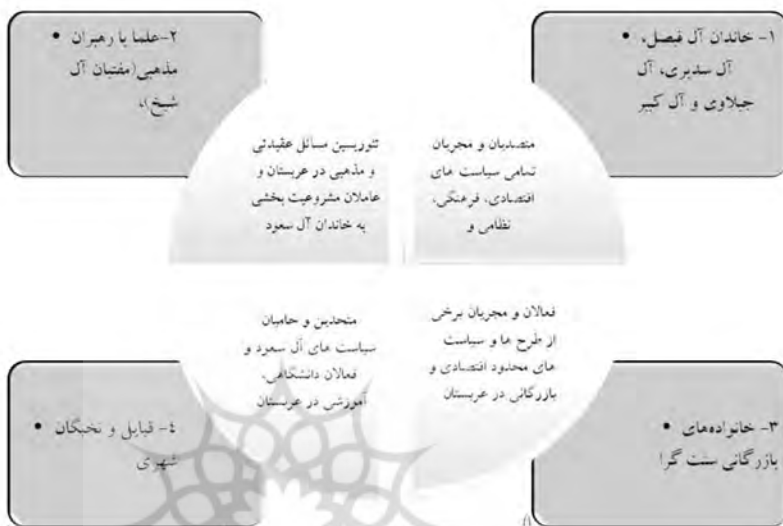
نمودار ۲: فعالان و مجریان قدرت در عربستان سعودی

شیعیان که عمدتاً در بخش شرقی قلمرو پادشاهی سعودی مستقرند، دارای جمعیتی محدود هستند که عموماً مورد تبعیض قرار می‌گیرند و در فرایند سیاسی مشارکت داده نمی‌شوند و در بخش کارگری فعالیت می‌کنند (Jones, 2006: 219).