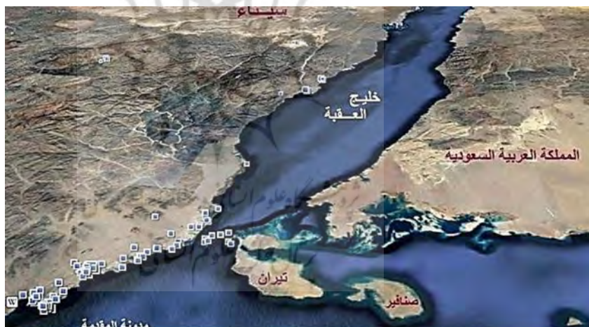
نقشه ۱: جایگاه سوق الجیشی جزایر صنافیر و تیران

سومین سیاست محمد بن سلمان در راستای تحقق پادشاهی بر حجاز را می‌توان تلاش‌های مضاعف وی در راستای زعامت و رهبری بر جهان اهل سنت دانست. این رویکرد را می‌توان ذیل مؤلفه پول در نظریه تافلر قرار داد. با نگرش به مواضع بن سلمان می‌توان دریافت که اصولاً وی خواهان زعامت کشورهای اسلامی و رهبری آنان است؛ چراکه در این راستا، از سیاست‌های متعددی نیز بهره‌گیری نموده است. به عنوان مثال، در خصوص سودان، با وعده‌های مالی سنگین نه تنها این کشور را تا حد زیادی مطیع خویش ساخت، بلکه سودان را در جنگ یمن به ائتلاف نظامی عربی اضافه نمود. در خصوص مصر نیز با حمایت‌های گسترده از سیسی و دشمنی آشکار با اخوان، نه تنها از یک رقیب قدرت‌مند، متحدی مطیع ساخت، بلکه جزایر استراتژیک صنافیر و تیران را از مصر دریافت و به مناطق تحت استیلای خود اضافه کرد (Aboulenein, 2017: 2).