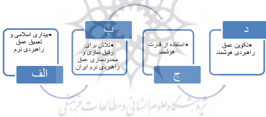
شکل شماره دو) فرایند شکل‌گیری عمق راهبردی هوشمند جمهوری اسلامی

عمق راهبردی هوشمند بر بستر عمق راهبردی نرم انقلاب اسلامی ایجاد می‌شود. عمق راهبردی نرم جمهوری اسلامی، سطوح گوناگونی دارد. نخستین لایه آن در بخشی از جهان اسلام است که ترکیب جمعیتی آنها شیعه است و قرابت فرهنگی - سیاسی در محیط اجتماعی با ایران دارد. لایه‌های بعدی به دیگر مناطق جغرافیایی - مذهبی دنیا مرتبط می‌شود که با اهداف و آرمان‌های انقلاب اسلامی همسویی دارد. انقلاب اسلامی بر وحدت همه مسلمانان اصرار می‌ورزید؛ به گونه‌ای که گراهام فولر در این باره می‌نویسد: