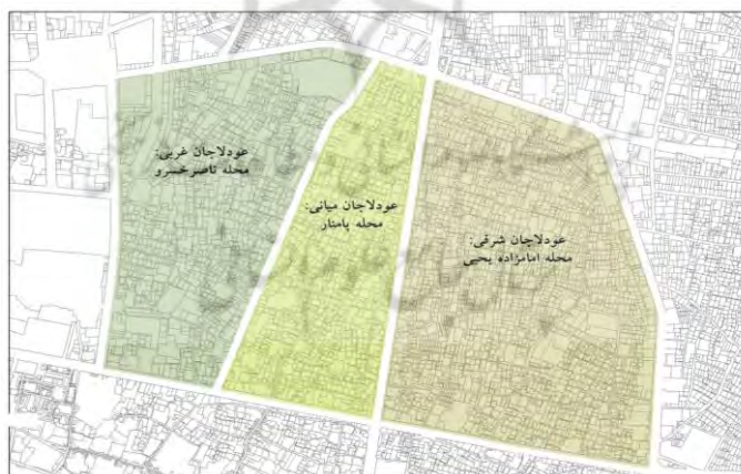
نقشه ۶. زیرمحله‌های عودلاجان

ناصرخسرو) نیز مرز میان این محله و ارگ حکومتی بود که پس از پرشدن خندق گرد ارگ در سال ۱۲۴۴ ش ( ۱۲۸۲ ق) ایجاد شد (فدایی نژاد و کرمپور، ۱۳۸۵). مرز جنوبی این محله که پیش از احداث خیابان بوذرجمهری (۱۵ خرداد کنونی) تا حوالی بازار مسگرها را در محله بازار کنونی در برمی گرفته است (نقشه‌های ۳، ۴ و ۵) پس از اجرای طرح «نقشه خیابان‌ها» و احداث خیابان بوذرجمهری در سال ۱۳۰۹ (عدل و اورکاد ۱۳۷۵: ۲۲۲)، همچنین الحاق بخشی از محله عودلاجان کهن به بازار، در حال حاضر بر خیابان ۱۵ خرداد منطبق است. خیابان‌کشی‌های سیروس (مصطفی خمینی کنونی) در زمان پهلوی اول و پامنار برخلاف مسیر گذر عودلاجان که بازار تهران را به ابتدای پامنار و محل دروازه شمیران در حصار صفوی وصل می‌کرد و ارتباطی ارگانیک با محله داشت، یکی از مشخصه‌های شهرهای کهن ایرانی بود (سلطان‌زاده، ۱۳۶۲: ۱۲۶). این خیابان‌کشی فاقد ارتباطی ارگانیک با کلیت محله بود و حاصل اتصال بخشی از گذر عودلاجان به خیابان بوذرجمهری به‌شمار می‌آمد. این فرایند در زمان پهلوی دوم و دهه ۱۳۴۰ محله را به سه پاره شرقی، میانی و غربی تقسیم کرد (نقشه ۶؛ کمیته هماهنگی، برنامه‌ریزی و طراحی بافت قدیم تهران، ۱۳۵۸: ۵۹) و آثاری را بر پایداری آن بر جای گذاشت (کمیته هماهنگی، برنامه‌ریزی و طراحی بافت قدیم تهران، ۱۳۵۸: ۶۷؛ فدایی نژاد و کرمپور، ۱۳۸۵). پس از این زمان مرزهای محله عودلاجان به شکل کنونی آن تثبیت شد.