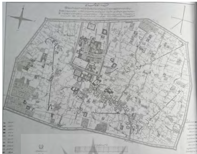
نقشه ۳. تهران در سال ۱۲۳۷ شمسی