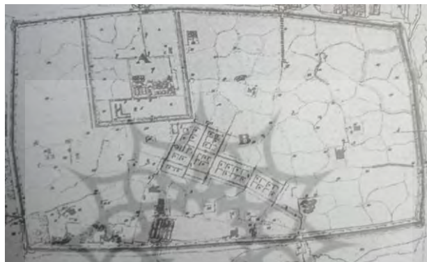
نقشه ۱. نخستین نقشه شهر تهران

نخستین نقشه تهیه شده از شهر تهران در سال ۱۲۰۵ شمسی (۱۲۴۱ق)، مقارن با بیست و نهمین سال سلطنت فتحعلی شاه به دست «نازکوف» یکی از افسران ارتش روسیه صورت گرفت (نقشه ۱). نقشه بعد را الیاس برزین، شرق شناس روس در سال ۱۲۳۱ ش (۱۲۶۸ ق) در چهارمین سال سلطنت ناصرالدین شاه و ۲۱ سال پس از نقشه نازکوف تهیه کرد (نقشه ۲) که نشان دهنده گسترش شهر در باغها و زمینهای درون حصار صفوی است که البته در مقایسه با تحولاتی که تنها چند سال بعد، در پایتخت به وقوع می پیوندد چندان زیاد نیست.