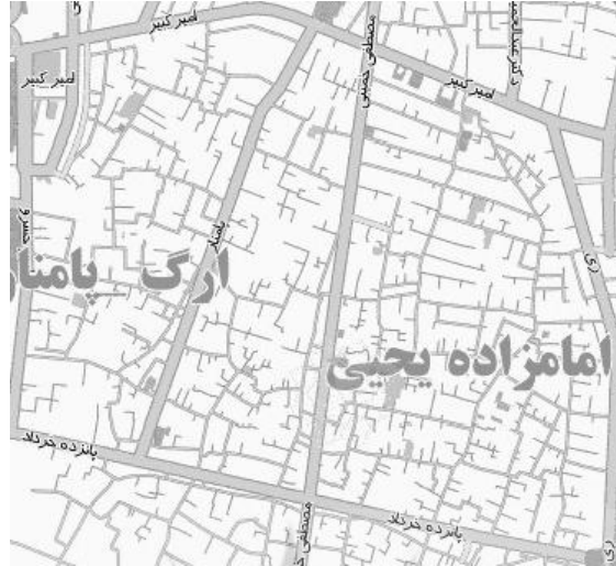
نقشه ۱. موقعیت کنونی محله عودلاجان