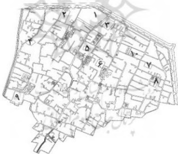
نقشه ۴. عودلاجان در سال ۱۲۳۷ شمسی