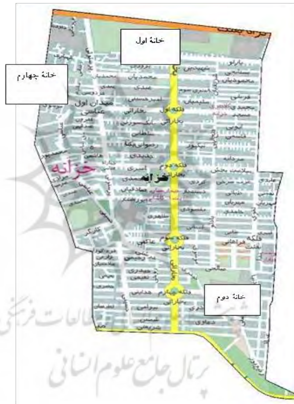
نقشه ۱. موقعیت خانه‌های اول، دوم و چهارم خانواده مورد مطالعه در محله خزانه

حسین و فاطمه اقامتشان را در کوی پروران در منطقه ۱۶ محله خزانه تهران آغاز کردند.