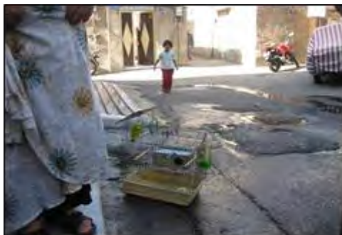
تصویر ۱. ورودی کوچه (آب‌های اضافی کوچه در چاه وسط کوچه جمع می‌شود)