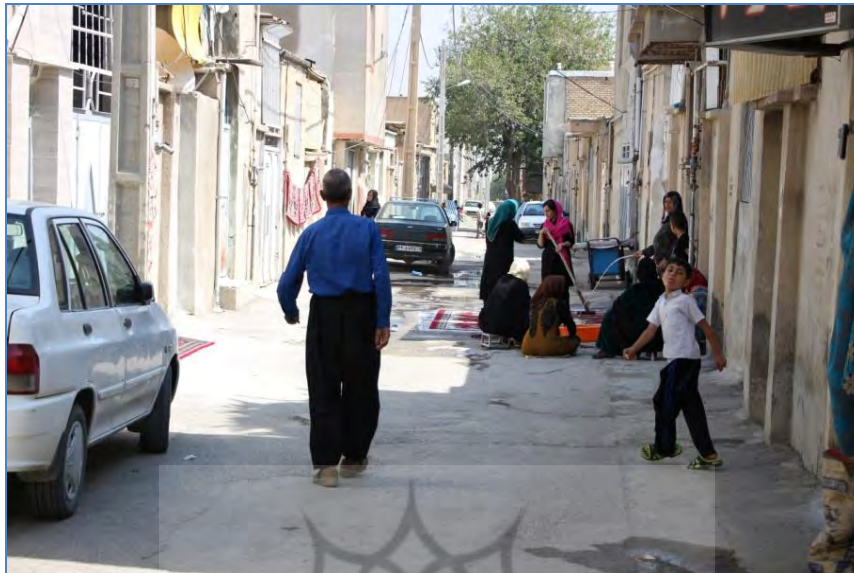
عکس ۳- کوچه نشینی زنان در سکونت‌گاه‌های غیررسمی

زنان کوچه نشین بدون توجه به این‌که کارشان چه پیامدهایی برای شهر دارد و تا چه اندازه باعث زشت شدن چهره شهر می‌شود تنها هدفشان بازگشت به روابط اجتماعی‌ای است که در زندگی روستایی تجربه کرده‌اند و اکنون شهر این امکان را از آن‌ها گرفته است. کوچه نشینی زنان سبب تحکیم شبکه‌های اجتماعی، تسهیل روابط اجتماعی و افزایش اعتماد اجتماعی می‌شود. از طرفی کوچه نشینی پیامدهای منفی نیز دارد. برای مثال تعاملات در این سکونت‌گاه‌ها موجب گسترش سرمایه اجتماعی میان‌گروهی می‌شود. چون اکثر ساکنان محلات حاشیه‌نشین به صورت گروهی به شهر آمده‌اند و کولونی‌های قومی را بنانهاده‌اند که قبیله‌گرایی و تعصبات قومی را تشدید می‌کنند. همچنین شلوغی کوچه‌ها، سخت شدن رفت‌وآمد، نگاه‌های خیره به رهگذر همگی باعث زشت شدن چهره شهر می‌شود.