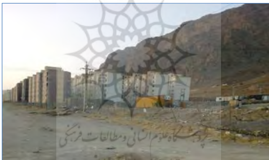
عکس ۲- عدم توجه به زیرساخت و فضای عمومی در مسکن مهر شهرک پردیس

است که در نتیجه آن امکان یکپارچگی و انسجام اجتماعی کم‌رنگ شده است» (قلی‌پور، ۱۳۹۵: ۲۴-۲۷) افزون بر این تمایزات اجتماعی و فرهنگی با این تکه‌پارگی منطبق است و مرزهای نفوذناپذیری را در شهر به وجود آورده است. انتظار می‌رفت که ساخت مسکن مهر در فضاهای خالی انجام پذیرد و یا حداقل این‌که با برخی مشاغل مزاحم (دیزل‌آباد) و تأسیسات نظامی جایگزین گردد تا شهر به سوی پیوستگی فضایی پیش رود. اما این مهم عملیاتی نشد و در مقابل، مسکن مهر در اطراف شهر در تمام جهات ساخته شد و پراکندگی شهری را فزونی بخشید. این نوع مداخله در فضا متناسب با شهر نبود و بر گسیختگی آن افزود.