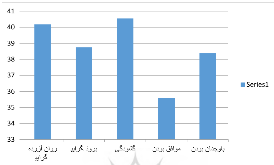
شکل ۲- نمودار مربوط به ویژگی‌های شخصیتی

همانطور که از شکل و نمودار ۴-۴۱ مشخص است بالاترین میانگین (۴۰.۵۵) مربوط به ویژگی شخصیتی گشودگی و پایین‌ترین میانگین (۳۵.۵۸) نیز مربوط به ویژگی شخصیتی موافق بودن است. برای بررسی ادعای وجود همبستگی بین دو متغیر کمی خشم والدین و پرخاشگری از تحلیل همبستگی استفاده می‌کنیم. همانطور که در جدول مشخص است ضریب همبستگی پیرسون و سطح معناداری و تعداد داده‌ها را نشان می‌دهد. بر اساس این خروجی از آن جایی که سطح معناداری کمتر از ۵ درصد است (۰/۰۰۰) معلوم می‌گردد همبستگی بین این دو متغیر وجود دارد.