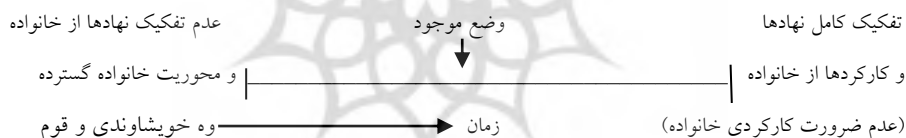
نمودار ۱: طیف میزان تفکیک نهادهای اجتماعی از خانواده

کردن فرزندان را کماکان به عنوان کارکردهای جهان‌شمول خانواده تلقی می‌کنند که حتی در جوامع غربی کنونی نیز خانواده عهده‌دار این کارکردهاست (همان، ۹۷). البته نباید از دگرگونی‌های شدیدی که در این زمینه‌ها در حال وقوع است غافل بود. وضعیت میزان تفکیک نهادها را از خانواده در طول تاریخ می‌توان در طیف نمودار ۱ مشاهده کرد.