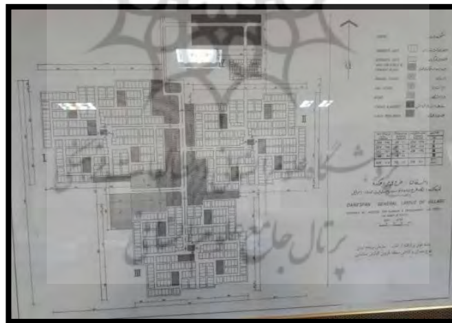
نقشه شماره ۱: نقشه اولیه دانسفهان پس از زلزله (حسینی، ۱۳۹۷/۵/۱۰)

اتاق ۳۲ متری یعنی ۴ در ۸ متری بود که دیوار به دیوار همدیگر قرار داشتند و از یک طرف به آشپزخانه و از طرف دیگر به در ورودی راه پیدا می‌کردند. از آنجا که معیشت اصلی اهالی دانسفهان، دامداری خانگی و کشاورزی بود، محلی نیز برای نگهداری احشام در نظر گرفته شده بود که فضایی ۴۸ متری در قسمت جنوبی خانه، با سقف شیروانی بود؛ بعدها مردم به سلیقه خود در این فضا باغچه و حوض اضافه کردند. درهای ورودی و خروجی در شمال و جنوب خانه‌ها از لحاظ جنس و شکل کلی یکسان بودند ولی بنا به کاربردها تفاوت‌هایی با یکدیگر داشتند. دری که در قسمت جنوبی خانه بود، پهن‌تر و مناسب برای عبور دام و تخلیه علوفه یا بار بود و به کوچه ۶ متری باز می‌شد. (نک: تصویر شماره ۲) دری که در قسمت شمالی خانه قرار داشت و به خیابان ۱۲ متری باز می‌شد، کوچک‌تر و مخصوص تردد ساکنان بود. داخل خانه‌ها هیچ گونه امکانی برای لوله‌کشی آب در نظر گرفته نشده بود اما در کوچه‌های ۶ متری برای تامین آب مورد نیاز مردم، فلکه‌هایی تعبیه شده بود که هر ۱۲ خانه (یعنی ۶ خانه سمت راست و ۶ خانه سمت چپ) که روبه‌روی هم بودند، از آن بهره‌مند می‌شدند. از آنجا که این فلکه دکمه‌ای داشت که آب آن با فشار بالا می‌آمد، به آن فلکه فشاری می‌گفتند.