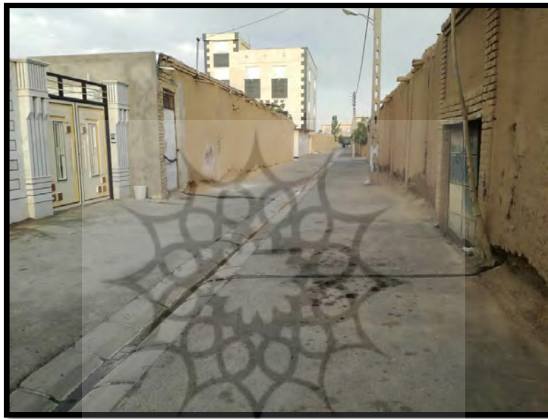
تصویر شماره ۱: کوچه ۶ متری که با عقب‌نشینی در دانشفهان جدید به کوچه ۸ متری تبدیل شده است. (صدیقه یوسفی‌رامندی، ۱۳۹۷/۵/۱۰)

چادرهایی که سازمان شیرخورشید تدارک دیده بود، روزگار گذراندند. تا اینکه دانشفهان فعلی از محل اعتبارات اهدایی مردم ایالات متحده آمریکا ۱ با چند کیلومتر فاصله از روستای تخریب شده، در جایی نزدیک به جاده ترانزیت همدان - تهران ساخته شد.