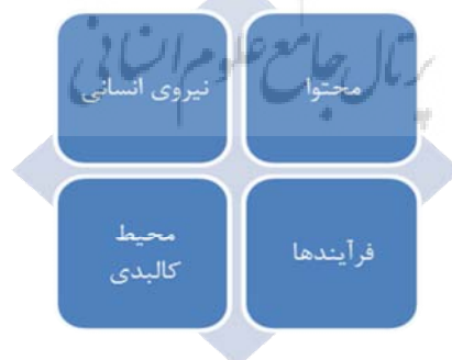
شکل 1: ابعاد دانشگاه اسلامی (مصدق و همکاران، 1393: 7)